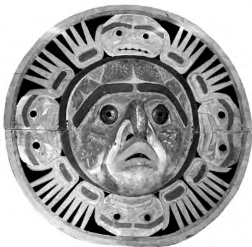
Maska Slunce, původem z vesnice Bella Coola, vyrobená indiány Nuxalk a získaná v roce 1870. (American Museum of Natural History, New York, katalogové číslo 16/1507)

Tyto eseje vznikly během dvou covidových let (tedy až na část stati o severoamerickém skalním umění) a byly určeny pro různé tisky či katalogy, kde nikdy nevyšly. Představují pro mne jeden víceméně souvislý text složený z několika střípků jedné myslí. Všechny byly nejenom promýšleny, ale hlavně žity.