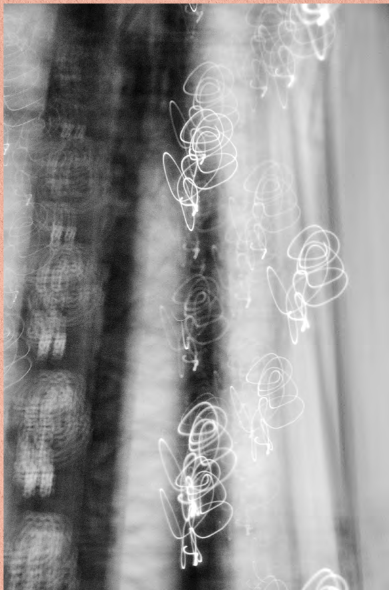
Důvody, kvůli kterým chodíme do hor.