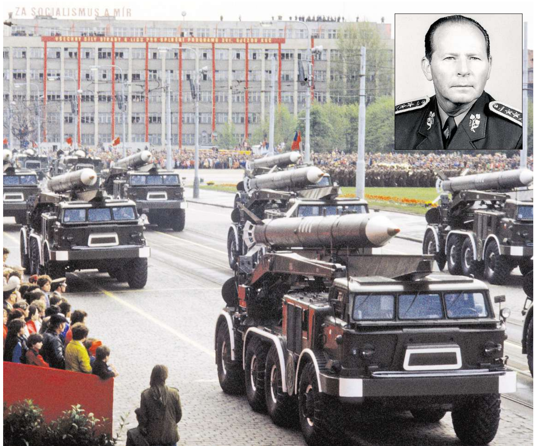
Přehlídka Československé lidové armády v roce 1985. Ve stejné době již jeden z jejích nejvyšších velitelů Mojmír Zachariáš (ve výřezu) označoval sovětskou invazi za chybu.

Popisuje náročnou práci s vojenskou technikou, zároveň uvádí příklady svědčící o tom, že armáda byla často zneužívána k řešení hromadících se hospodářských problémů.