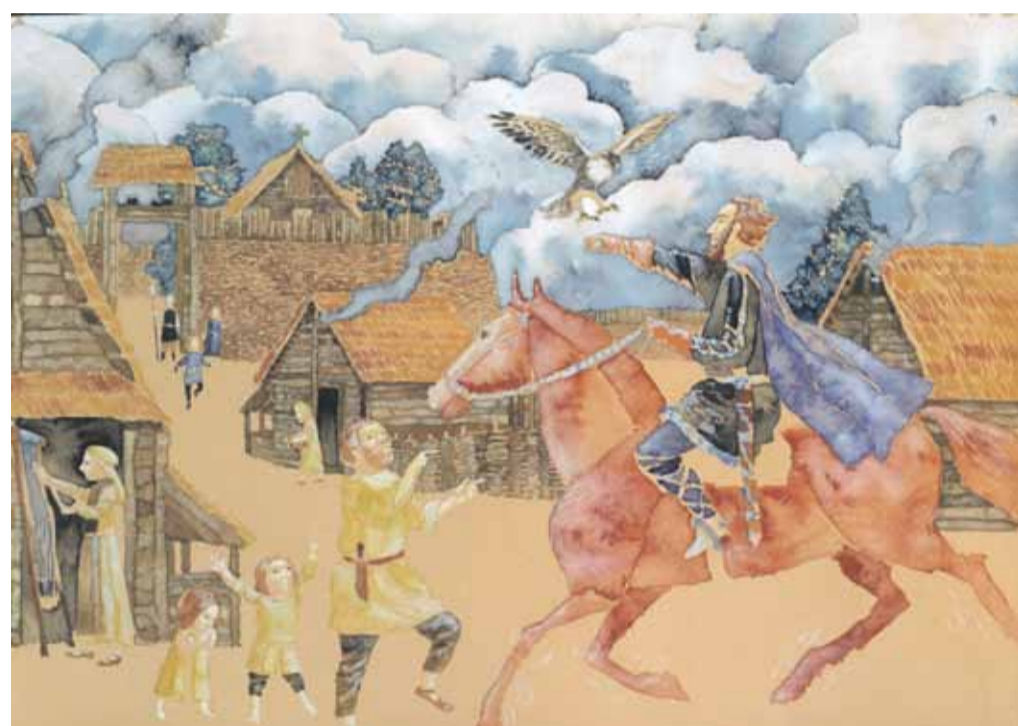
„Olymp kraje“ – Plešivec v době bronzové

Brdy se opět otevírají veřejnosti. Byla z nich sňata klatba uzavřeného, zakázaného prostoru. Monografie Střední Brdy – Hory uprostřed Čech přichází jako na zavalanou.