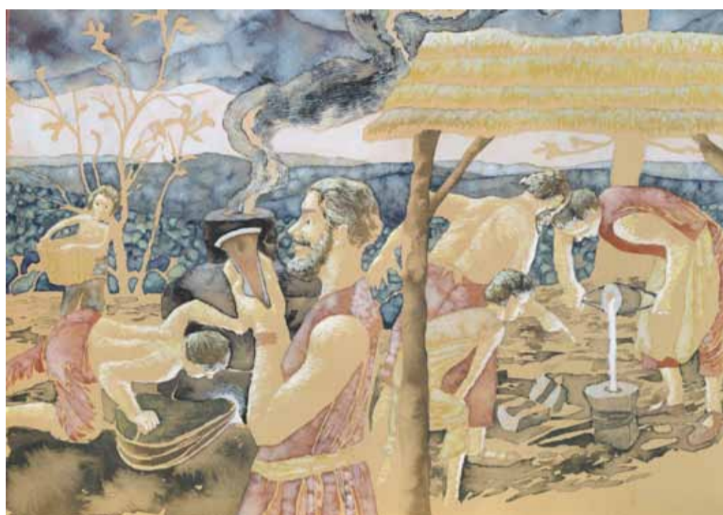
Božen patřila k překrásným pravěkým hradištím...