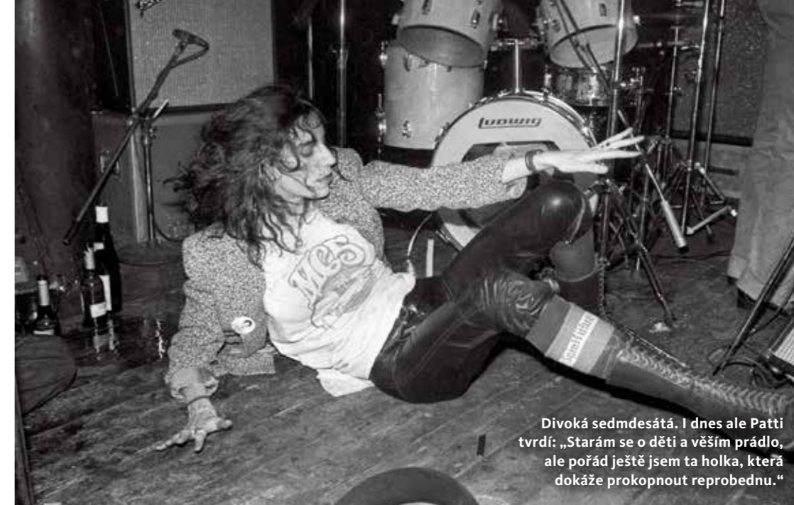
Divoká sedmdesátá. I dnes ale Patti tvrdí: „Starám se o děti a věším prádlo, ale pořád ještě jsem ta holka, která dokáže prokopnout reprobrednu.“

Zakrátko se ale seznámila se skupinou umělců – Jimi Hendrix, Janis Joplinová, básníci Gregory Corso a Allen Ginsberg. Patří k nim i spisovatel William Burroughs, duchovní otec beatníků a autor termínu heavy metal. Jednou, když si Patti zase stěžovala, že nemá peníze, jí řekl: „Hlavně si buduj dobré jméno.“ – „Vůbec jsem nechápala, jak to myslí, vždyť se jmenuju Smith,“ vzpomínala Patti ironicky o mnoho let později.