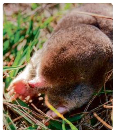
Krték východoamerický ( Scalopus aquaticus ). Tento druh krtka patří mezi živočichy s velmi dobře vyvinutým „stereočichem“. Dokonale se orientuje podle pachů v prostoru.