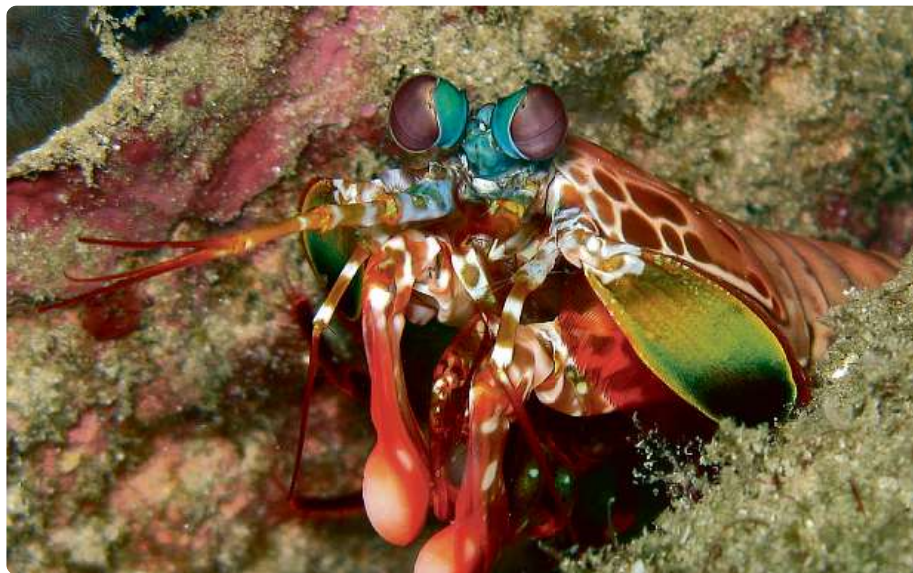
Strašek paví ( Odontodactylus scyllarus ). Strašci se při vývoji zraku ubírali po 400 milionů let vlastní cestou. Mají v oku receptory pro šestnáct různých barev. Vnímají i různé formy polarizovaného světla.