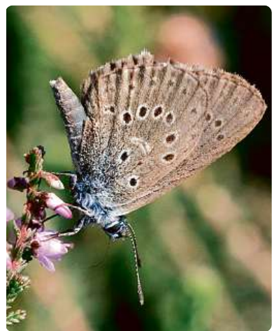
Modrásek hořcový ( Maculinea alcon ). Housenky tohoto motýla dokážou vylučovanými pachy oklamat mravence Myrmica schencki natolik, že si mravenci odnesou housenku do mraveniště a tam se o ni obětavě starají.

Ale mnohé z lidských smyslových vjemů jsou zvířatům naopak cizí: „Jeskynní ryby jsou slepé, delfinům zbyla z chuti pouze slaná a kyselá a včely registrují ve srovnání s člověkem jen třetinové spektrum pachů a vůní...“ Jak autor upozorňuje, živočišné ovšem také disponují dovednostmi, jež jim můžeme jen závidět. Přibližuje je nejen fakty, ale také porovnáním s adekvátními možnostmi člově-