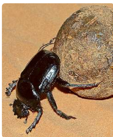
Vruboun posvátný ( Scarabaeus sacer ). Při válání kuličky z trusu tuto brouci drží přímý směr, i když tlačí kuličku zadními končetinami s hlavou skloněnou k zemi. Orientují se podle slunce na obloze.