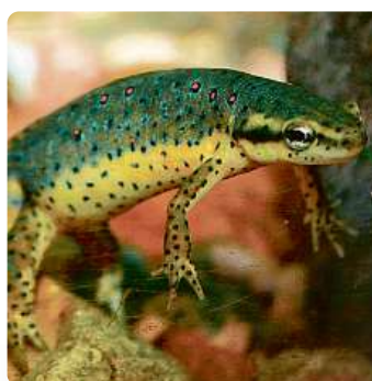
Čolek zelenavý ( Notophthalmus viridescens ). Obojživelník obývající lesní jezírka Severní Ameriky patří k tvorům, kteří jsou vybaveni vnitřním kompasem a orientují se podle magnetického pole Země.