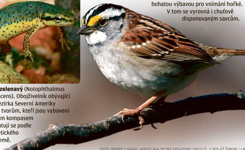
Strnavec bělohřdlý ( Zonotrichia albicollis ). Mezi ptáky, kteří spektrem chutí přilíží nevyvíjejí, tvoří strnavec výjimku bohatou výbavou pro vnímání hořké. V tom se vyrovná i chuťově disponovaným savcům.

FOTO: REPRO Z KNIHY JAROSLAVA PETRA DESATERO SMYSLŮ // KOLÁŽ ŠIMON / LN