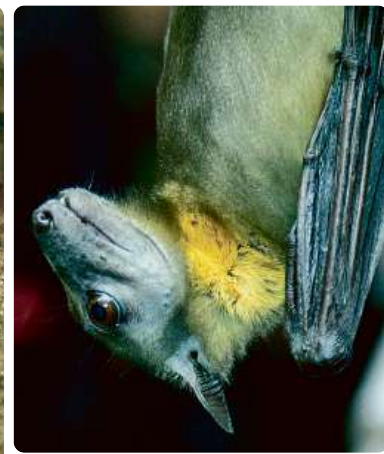
Kaloň plavý ( Eidolon helvum ). O schopnost echolokace evolučně přišel, o těchto dovednostech jeho předků ovšem svědčí velké vnitřní ucho, které se mu zakládá v hlavě během embryonálního vývoje a svými rozměry odpovídá vnitřnímu uchu kaloňů echolokací ovládaných.