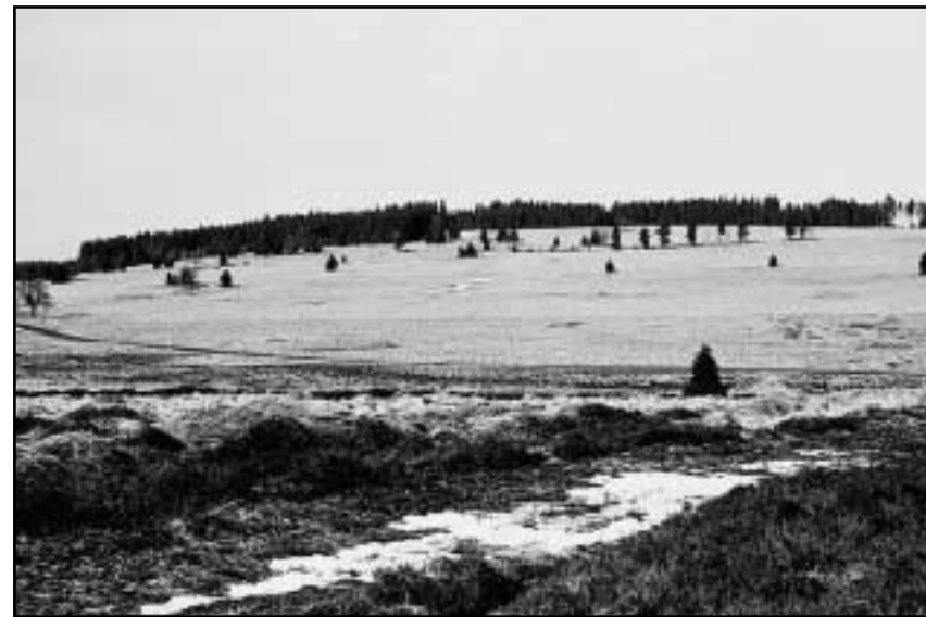
Místo, které zbylo (nebo vzniklo?) na místě obce Rolava.

Vešel jsem proto do svahu a sedl si těsně pod lesem na kus zídky vystupující z porostu. K orientaci mi pomáhaly zbytky cest, stromořadí jeřábů a linie lesa. Takto jsem objevil střed zaniklé obce. Stráň byla velmi řídko zastavěná, mezi domy mu-