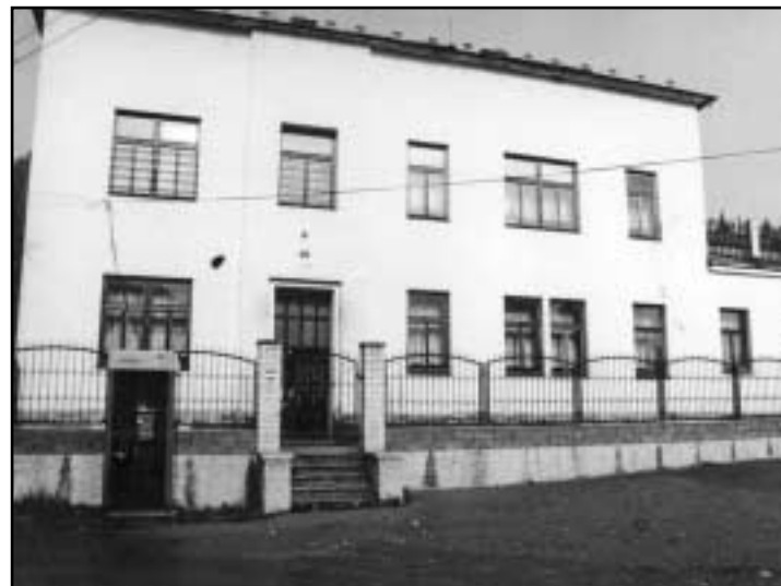
Dnes je náves oplocena a před kostelem sídlí ústav sociální péče.

Obec také změnila taktiku ve vztazích s rekreanty. Začalo se s odprodejem půdy a stavebních parcel. Pokud o pozemky neprojevil zájem restituent, mohl stát, respektive obec, nabídnout