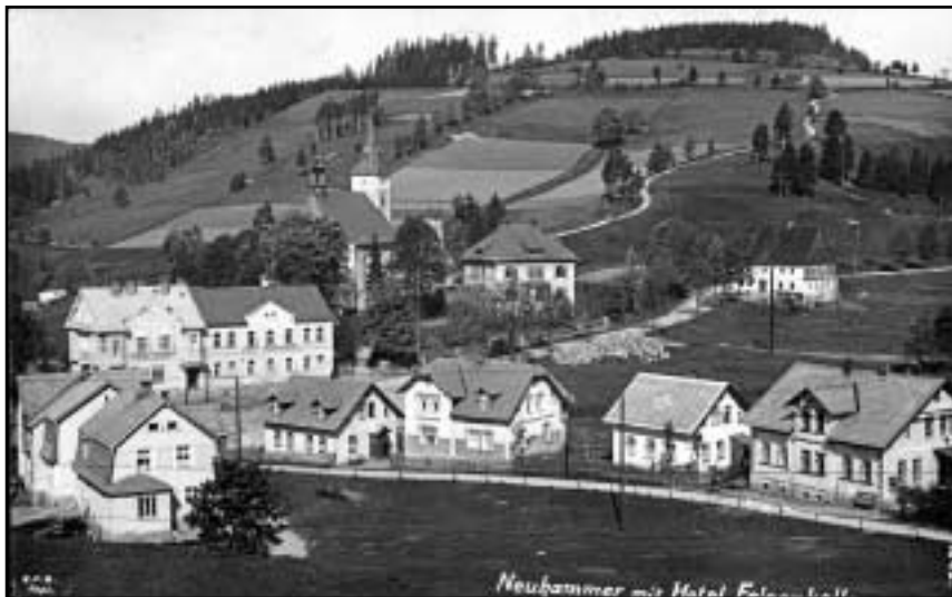
Pohled na centrum obce Nové Hamry a Hofberg v roce 1931.

kraj a obec Přebuz (Fribus) od 15. století žila. Ještě dnes jsou zde k vidění památky na toto období. Neklamnými znaky těžby jsou tzv. „pinky“ ve stráních (např. nad obcí Rudné ve stráni Skalnatného vrchu – Steinberg), které vypadají jako díry po dělostřeleckých granátech. Jsou to trychtýřovité propadliny nad stropem šachty. Další technickou památkou zdejšího kraje je vodní kanál, který přiváděl vodu z řeky Rolavy na území obce Rolava až pod Havraní vrch nad obcí Rudné. Toto jedenáct kilometrů dlouhé dílo pomáhalo při rýžování cínu. V roce 1930 žilo v městečku Přebuz 1 396 obyvatel a dnes pouhých 56. Tato parovinatá oblast končí Kraslickým Špičákem (Spitzberg – 991 m) a úchvatným Rájeckým údolím (Nancy), kde svahy prudce klesají z náhorní plošiny a padají do údolí obce Stríbrná (Silberbach) a města Kraslic (Graslitz), odkud se dále vlní již jen 800 metrů dosahující kopce, které nadobro končí u Vysokého kamene (Hoher Stein – 773 m) u vsi Kostelní (Kirchberg). Kopce se svažují kolem údolí až do Lubů (Schönbach). Zde se krajina rovná a nachází se zde doly na kaolín.