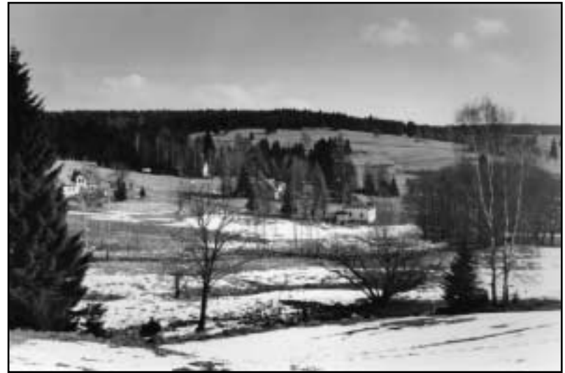
Dnes je celá tato část obce pustá. Ve stráni je možné najít základy všech původních staveb. V údolíčku stojí pár domů, stráně jsou však prázdné.

Z Rolavy jsem zamířil na Kraslický Špičák (Spitzberg) a došlo do Stříbrné. Na mokré cestě se mě zeptal lesák na motorce,