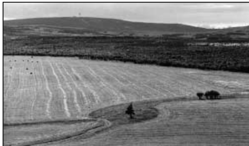
Píšťalka. Krajinné obrazce, které si měděnští traktoristé zřejmě předávají po generace.

Ervěnice, ale německy zcela jinak – Seestadt. V době, kdy zde němečtí obyvatelé žili, nacházelo se městečko na břehu ohromného jezera a hlavní zdejší obživou byl rybolov. Odtud tedy německý název, který značí „Jezerní městečko“. Jezerní plocha se však vlivem sedimentace splavenin stále zmenšovala, takže se jezero rozdělilo postupně na několik menších jezer. Tzv. Komořanské jezero mezi Ervěnicemi, Komořany (Kommern) a Dolním Jiřetínem (Nieder Georgenthal) mělo ještě na počátku předminulého století plochu kolem 140 hektarů. To už ale bylo porostlé rákosím a jinými vodními rostlinami a mělo bažinaté břehy. V krajině kolem Komořanského jezera bývaly častější než jinde epidemie různých nemocí. V roce 1683 zemřela například řada zdejších obyvatel na mor. Vyskytovala se zde