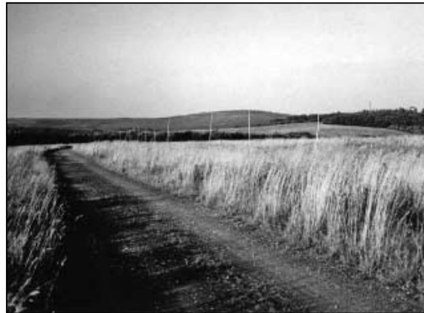
Plochý hřeben Krušných hor s Bouřňákem a Pramenáčem v pozadí.

Režim a hlavně lidé po roce 1945 přistupovali ke krajině Sudet jako k dobytému území po nepřátelích, a podle toho se k ní chovali. Komunisté po roce 1948 zase ukradli obyvatelům to, co jim předtím dali. Bohatství ukrývajících se v horách a v nížinách posílali „jako švestičky ze zahrádky“ hlavnímu autorovi komunistických idejí – Sovětskému svazu. Českoslovenští komunisté mu dali vše, na co ukázal – uhlí, uran, zlato, stavební materiály a nejhonosnější zámky. Jako bychom zapomněli, že to už je součástí naší republiky. Že by to mělo být území, které máme chránit a zachovat jeho specifičnost. Vytvořit z něj ko-