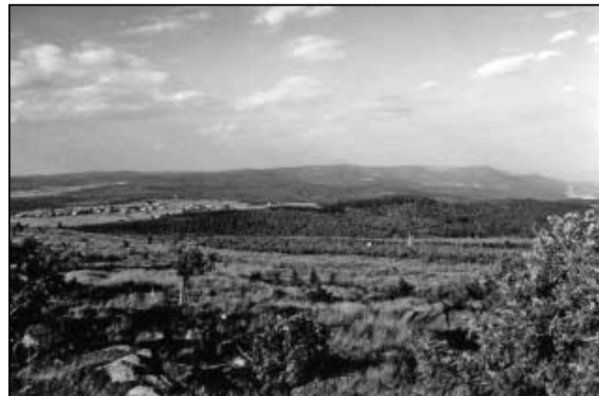
Parovinný hřeben Krušných hor. Zřetelně je vidět pomalý nástup ze saské strany a prudký svah do Čech.

Turisticky ideálním terénem je okolí Nové Vsi v Horách (Gebirgsneudorf), kde člověk může vylézt na již zmiňovanou Medvědí skálu, cestou se vykoupat v Dřevařském rybníku s krásným výhledem a při stoupání do svahu kopce obdivovat malebnost oněch pastvin v horách. Přímo na vrchol Medvědí skály se musí odbočit ze značené cesty a prodírat se pozvolným svahem k vrcholu, kde se tyčí skupina skal a zbytek dřevěného srubu. V horském dni jsem měl sice strach ze zmijí, ale protože jsem kolem