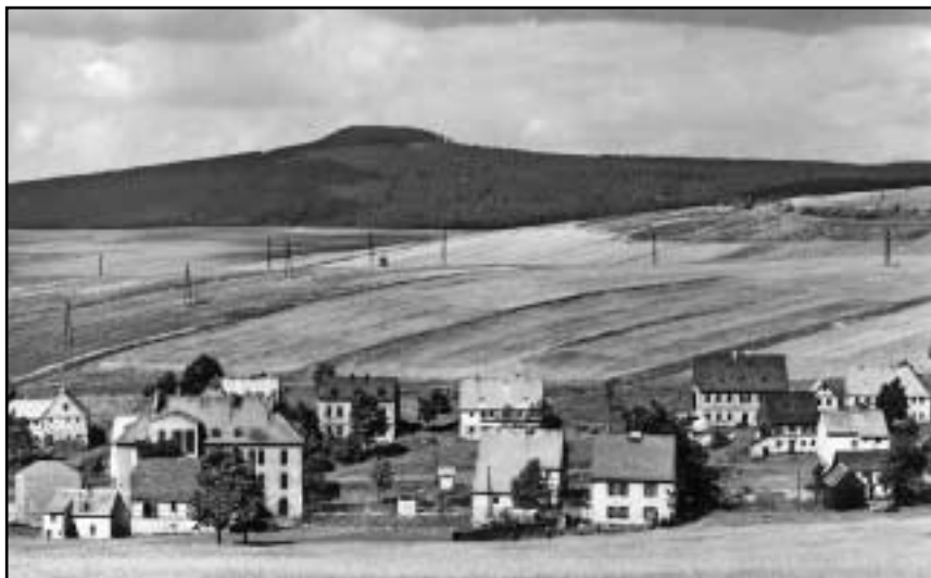
Bývalá obec Rusová (Reischdorf) v 60. letech 20. století. V pozadí Je- lení hora – 993 m. n. m.

Zdejší krajina je tichá, zapomenutá a podobně je tomu i se značením turistických cest. Mnohokrát jsem přešel odbočku a hledal, kde jsem se ztratil. Někdo porazí strom a nestará se o to, že stál na rozcestí a byla na něm značka. Jindy jsem zase viděl strom, na nějž byla značka namalována asi před deseti lety, a jak strom mohutněl, značka praskala a praskala, až z ní zbylo jen pár čar na kůře. Mnoho tras by si zasloužilo nové značení. O rozcestnících nemluvě.