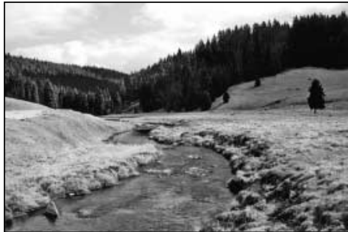
Říčka Rolava na území bývalé obce Chaloupky (Neuhaus). Je to zřejmě nejkrásnější a nejpuštěnější údolí v západním Krušnohoří.

Území obce je otevřeno do všech směrů, a proto se zde vyskytuje tak drsné klima. Severní a severozápadní větry s častými srážkami jsou převažujícím typem počasí. Mlhy zde vznikají často, neboť jsou produktem všeobíhajícího lesa. V takto vysokém položení vsi neudivuje, že se zde již v říjnu očekává první sníh a že sníh