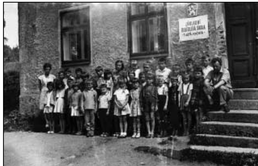
Poválečný „baby boom“ zaplnil školy v celém pohraničí.

K zavření místní obecné školy a školky došlo v tomto roce pro nedostatek dětí (4). Hlavní příčinu nutno hledati v tom, že je zde