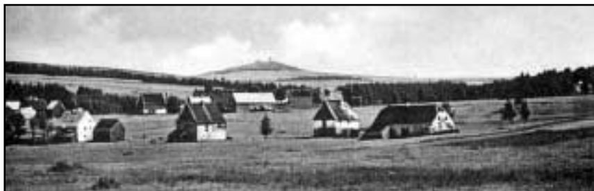
Osada Mezilesí (Orphus) mezi bývalou Přísečnicí a Měděncem ve 20. letech 20. století. Na obzoru je vrchol Mědník 910 m. n. m.

vesnice Výsluní až po vrchol Klínovce lze pozorovat pravidelné, vždy po dvou vedle sebe se vyskytující kopce. Jelení hora (Hirschberg – 997 m) a Velký Špičák (Spitzberg – 965 m), které trčí po obou stranách Přísečnické vodní nádrže, představují u nás raritní obnažené čedičové stolové hory, které vypadají jako kdesi v Arizoně. (Asi tam stojí na věčně stráži jako upomínka na bývalé městečko Pressnitz, tedy Přísečnice, které bylo zatopeno. V roce 1930 zde žilo 2 045 lidí, z toho dvacet čtyři Čechů.) Další jsou Kamenný (Steinberg – 963 m) a Bärenstein (932 m), zakulacené čedičové kupy stojící za sebou. Bratry jsou hlavně ale Klínovec (Keilberg – 1244 m) a Fichtelberg (1214 m), strážící vstup do poslední, tolik odlišné třetiny Krušných hor na západě.