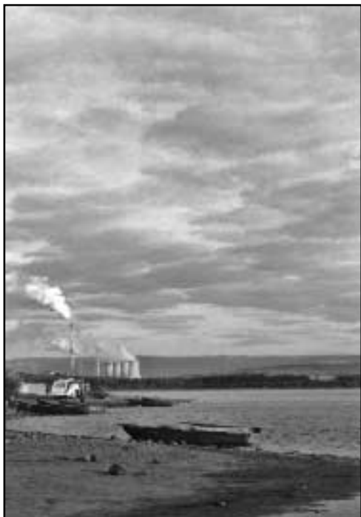
Kempování na Nechranické vodní nádrži má svá nezaměnitelná specifika.

Ervěnice, ale německy zcela jinak – Seestadt. V době, kdy zde němečtí obyvatelé žili, nacházelo se městečko na břehu ohromného jezera a hlavní zdejší obživou byl rybolov. Odtud tedy německý název, který značí „Jezerní městečko“. Jezerní plocha se však vlivem sedimentace splavenin stále zmenšovala, takže se jezero rozdělilo postupně na několik menších jezer. Tzv. Komořanské jezero mezi Ervěnicemi, Komořany (Kommern) a Dolním Jiřetínem (Nieder Georgenthal) mělo ještě na počátku předminulého století plochu kolem 140 hektarů. To už ale bylo porostlé rákosím a jinými vodními rostlinami a mělo bažinaté břehy. V krajině kolem Komořanského jezera bývaly častější než jinde epidemie různých nemocí. V roce 1683 zemřela například řada zdejších obyvatel na mor. Vyskytovala se zde