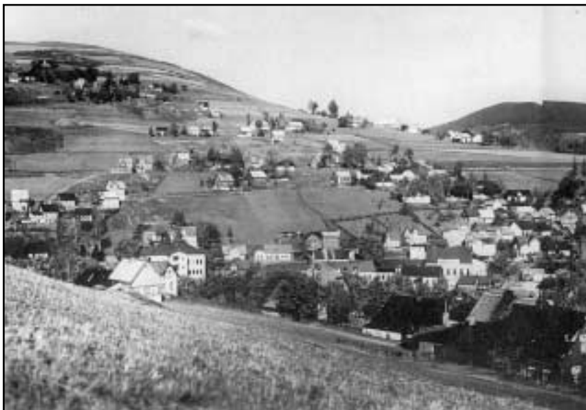
Další ukázka typického sudetského typu osídlení – obec Tisová u Kraslic (Eibenberg) ve 30. letech 20. století. Pole, pozemky a domy stály až vysoko na kopcích v tak prudkých svazích, že dnes se nám zdá zcela nemožné na těchto místech udržet ornici.

v pohraničí poslouchala pouze říšské rozhlasové stanice, které šířily vlastní ideologii a nenávisť k Čechům. Tak například až do roku 1938 vysílala v ČSR pouze jedna rozhlasová stanice – Radiojournal. Německy se do té doby na jejích vlnách mluvilo pouze jednu hodinu denně, a to ještě v době, kdy většina posluchačů pracovala nebo již spala. Protože se vysílač nacházel v Praze a nebyl příliš výkonný, bylo velmi nelehké naladit v pohraničí českou stanici. Obsahovou stránku vysílání měl na starost německý spolek Uranie. Jeho činnost nebyla však profesionální a zcela chyběl živý kontakt s posluchači a zpětná vazba, v pohraničí zvláště. Byla to spíše hodinka kultury a hudby pro pražské německé a židovské intelektuály. Výsledkem nezájmu byl masový poslech říšských stanic, jež si byly vědomy tohoto