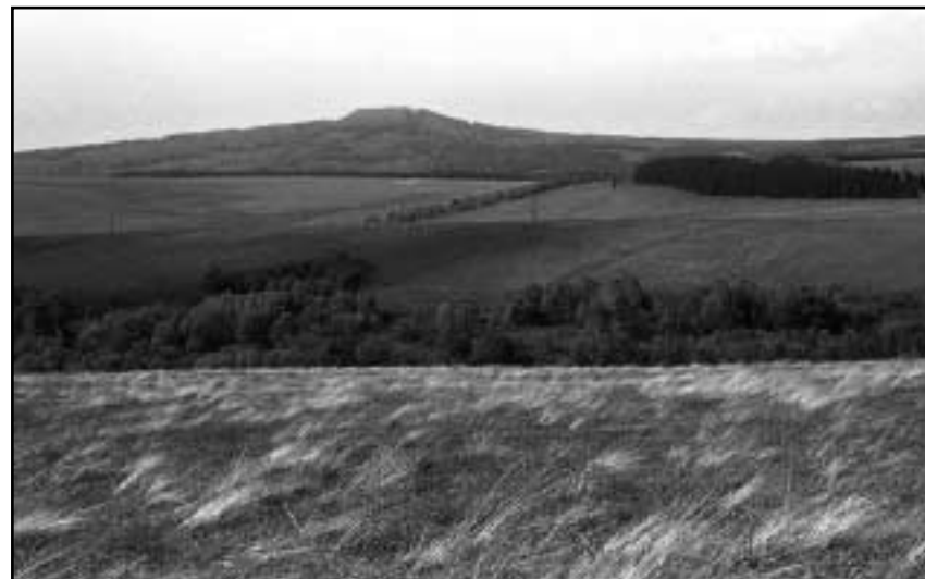
Dnešní pohled na Rusovou. Vesnice ustoupila stavbě vodní nádrže Pří- sečnice, ačkoliv nebyla zatopena. Kolem nádrže na pitnou vodu je totiž ochranné pásmo.

Podobným rázem se vyznačuje část pohoří od Hory Svatého Šebestiána (Sebastiansberg nebo Basberg) po Klínovec. Opět překrásné louky, stromořadí jeřábů u silnic, daleké rozhledy. V Hoře Svatého Šebestiána jsem nasedl na vlak. Minul jsem Výsluní (Sonnenberg), protože zdejší zastávka se nachází pár kilometrů od městečka. Ani jsem si jí nevšiml, venku pršelo a byla zima, takže skla ve vlaku byla zamlžená. Všiml jsem si ale hezké dívky, která seděla přes uličku naproti mně a pěkně se na mě koukala. Když jsem vystoupil v Měděnci, zahlédl jsem,