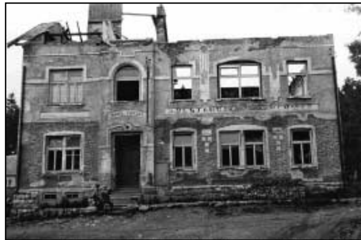
Těsně po válce vyhořela restaurace a kulturní centrum obce Rudná na návsi. Byla opravena, ale sloužila jinému účelu. Nejprve jako objekt školy v přírodě a později jako ústav sociální péče.

V roce 1960 knihovník stále chválí kulturní úroveň svých čtenářů, ale podotýká, že: „...je třeba vyvinout velké úsilí, mají-li lidé čísti, poněvadž přibýváním televizorů nastává úbytek čtenářů.“ Koncem roku 1960 bylo v obci pětatřicet televizorů. V roce už 1961 Šperl musí změnit strategii, aby knihovna a čtenářstvo přežili: „Knihovna měla letos výpůjček 1 490, svazků 912 100 německých, čtenářů 84. I když čtenářů ubývá v tom poměru, jak přibývá televizorů, tedy počet výpůjček je uspokojivý díky mládeži a rekreantům. A když hora nejde k Mohamedovi... tak se i knihovník na to zaměřil a nosí lidem knihy do bytu. Televizorů je ke konci roku 53.“ Zde je již cítit zvyšující se zájem rekreantů o obec a kulturu, zatímco místní lidé tráví volný čas více před televizní obrazovkou. Do této doby interpretoval kronikář vzrůstající množství televizi pouze jako symbol blahobytu a lepšího žití. V roce 1962 však nastává zvrat: „V tomto roce na-