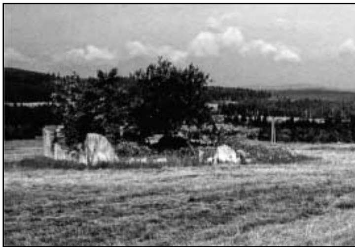
Zbytky domu kdesi mezi Božím Darem a Rýžovnou.

po Auersberg (1019 m) na německé straně. V průměrné nadmořské výšce 950 metrů rozděluje centrální Krušné hory od západní části. Hned pod ním se nachází centrum této části, město Nejdek (Neudeck), sportovní areál Nové Hamry (Neuhammer), „obchodní centrum“ – největší vietnamské tržiště západních Čech Potůčky (Breitenbrunn) a také vesnička Rudné (Trinksaifen), kde stojí chalupa, v níž jsem vyrůstal.