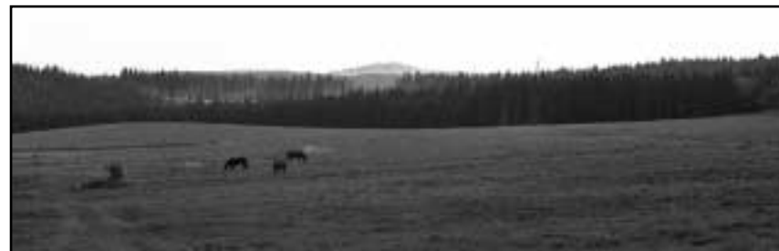
Místo osady dnes zůstaly pouze pastviny.

V Měděnci, kde jsem se posiloval před výstupem na Klínovec, jsem v hospodě uviděl tři mladé cyklistky a dal se s nimi do řeči. Přejížděly přes celé Krušné hory. Já jsem jim zase vyprávěl, že je přecházím pěšky. Jely na Boží Dar, kde chtěly přespat. Dohledně jsme se, že se tam potkáme. Dělal jsem si z nich ještě legraci, že tam na ně počkám. Počítal jsem, že s třemi pivy v nohou se tam z Měděnce dostanu za tři hodinky. Vytáhl jsem zpěvník a hulákal do kraje, čímž jsem ještě zvýšil rychlost. Když mě pak někde před Horní Halzí (Oberhalz) holky předjely, prvenství jsem sice ztratil, ale ten pomyslný závod mne táhl až na vrchol a pomohl mi škrábat se s dobrou náladou sjezdovkou na Klínovec.