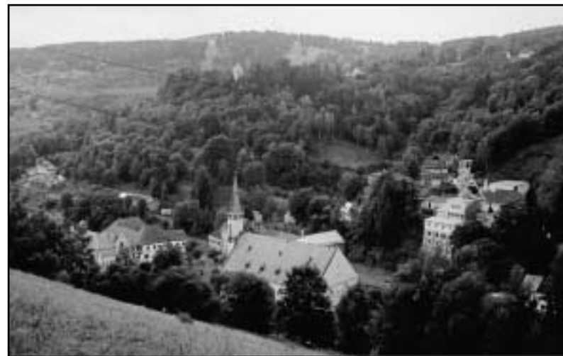
Z promenádní krajiny se stala zarostlá džungle skrývající mnohé jizvy.

Poslední nejzápadnější, nejčistší, nejvíce křivolaká a nejbujnější část hor od Božího Daru až po Luby (Schönbach) je odlišná. Je zde zřetelně cítit změna krajiny. Mizí absolutní dominance průmyslu v podhůří a krajina se roztahuje do dálav, bez