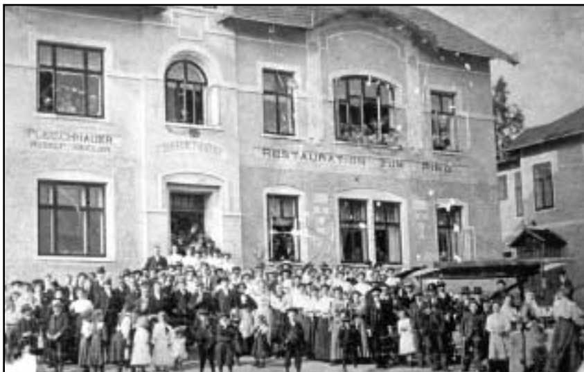
Bývalé centrum obce Rudné – náves a restaurace Zum Ring ve 20. letech 20. století.

Po roce 1989 nenastala v počtu obyvatel žádná výraznější změna. V první polovině 90. let někteří lidé rekreační objekty prodali. Na vině byl většinou nedostatek peněz na dojíždění a rekonstrukce. S pomocí německých rodáků se místním podařilo opravit kostel. Bývalí obyvatelé také společně s pár místními začali organizovat setkání rodáků. Většina místních lidí si této aktivity spíše nevšimla nebo je už přestala zajímat. Pouze Němci, kteří zde zůstali, a rekreanti je brali na vědomí.