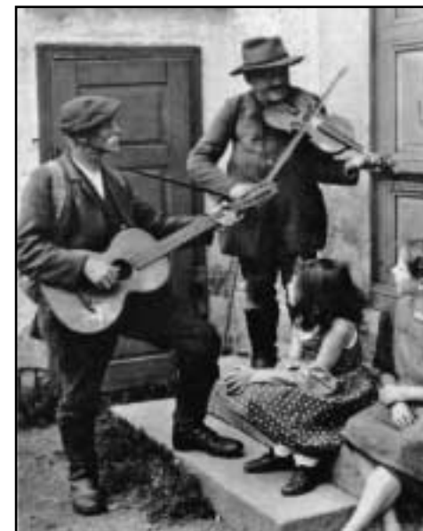
Mezi jednotlivými obcemi i regiony se pohybovali potulní hudebníci. Snímek je z 20. let 20. století.

Už v roce 1918 němečtí obyvatelé zřetelně ukázali, že by radši viděli jako svoji vlast Německo nebo Rakousko. Vzhledem ke geopolitické poloze Československé republiky však odtržení těchto oblastí nebylo možné. Tyto separatistické snahy utnula až československá vojska. S tímto faktem musel každý prvo-republikový kabinet počítat, tedy s binární politickou opozicí