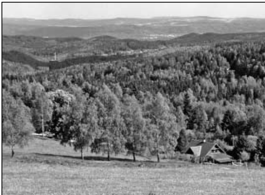
Pohled na údolí Rudenského potoka z vyhlídkového bodu Havraní vrch.

zde 3 622 německých obyvatel. V obci Vysoká Pec bylo zkonfiskováno 74 domů či pozemků a v obci Rudné 148 domů.