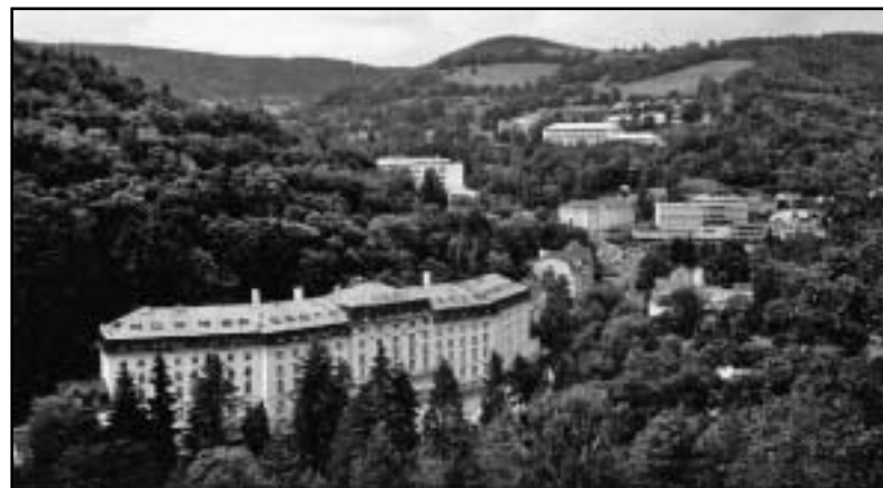
Město Jáchymov dnes. Stavby utopené v zeleni. Problém s jejím udržováním je v tom, že je vedena jako les, nikoliv jako městská zeleň.

Ubíráš-li se proti předpokládanému směru proudu Bíliny, která je zde znetvořena a vedena betonovým žlabem, do míst, kde je již řeka skutečně řekou, jako v nějaké zlomyslné pohádce platí i zde, že nesmíš pohledět kolem sebe, nebo dokonce vzhůru. Neuposlechněš-li, spatříš, jak ti před očima umírá les. Smrky tedy v údolí rezavějí a lze vidat i listy buků, popálených kyselým