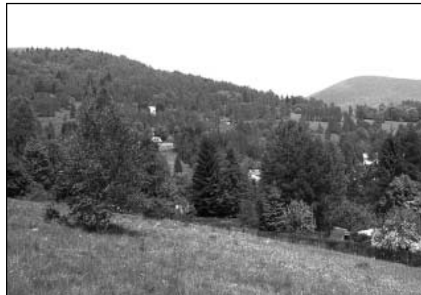
Dnes je výše položená část obce Tisová zaniklá. Jižní stráň kopce Tisovec (807 m. n. m.) zarostla.

v pohraničí poslouchala pouze říšské rozhlasové stanice, které šířily vlastní ideologii a nenávisť k Čechům. Tak například až do roku 1938 vysílala v ČSR pouze jedna rozhlasová stanice – Radiojournal. Německy se do té doby na jejích vlnách mluvilo pouze jednu hodinu denně, a to ještě v době, kdy většina posluchačů pracovala nebo již spala. Protože se vysílač nacházel v Praze a nebyl příliš výkonný, bylo velmi nelehké naladit v pohraničí českou stanici. Obsahovou stránku vysílání měl na starost německý spolek Uranie. Jeho činnost nebyla však profesionální a zcela chyběl živý kontakt s posluchači a zpětná vazba, v pohraničí zvláště. Byla to spíše hodinka kultury a hudby pro pražské německé a židovské intelektuály. Výsledkem nezájmu byl masový poslech říšských stanic, jež si byly vědomy tohoto