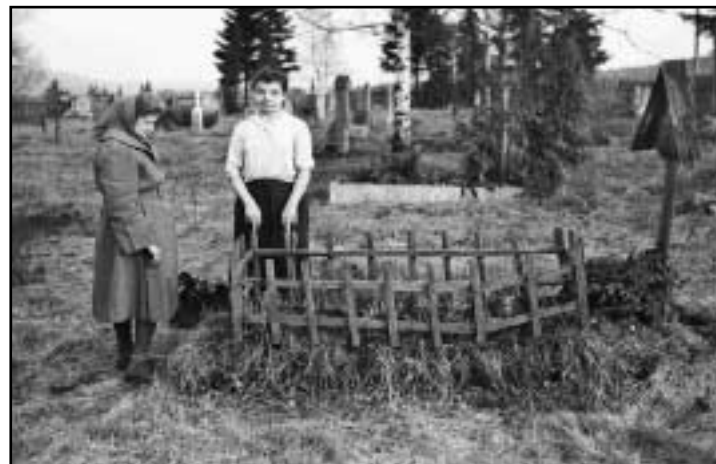
Teprve nad hrobem někoho blízkého pochopíte, že citová pouta lze mít i k symbolům v krajině a že se k nim člověk má vracet a starat se o ně.

Po odsunu ve Vysoké Peci zůstal hřbitov původních starousedlíků, o který se nikdo nestaral, a tak začal zarůstat a mizet před očima. Od poloviny 80. let se sem začali sjíždět lidé, kteří zde dříve bydleli, a chtěli navštívit i svůj starý hřbitov. Co užřeli, byla ale zdevastovaná ruina. Hroby bylo mezi vysokou trávou, kopřivami a keři těžko najít. Rekonstrukce začala teprve počátkem 90. let. Nejprve byl obnoven plot, poté pár nadšenců posekalo trávu, vytrhalo kopřivy a vykácelo keře. Dnes je hřbitov vyčištěný. Ale tím více vyráží dech jeho skutečný stav.