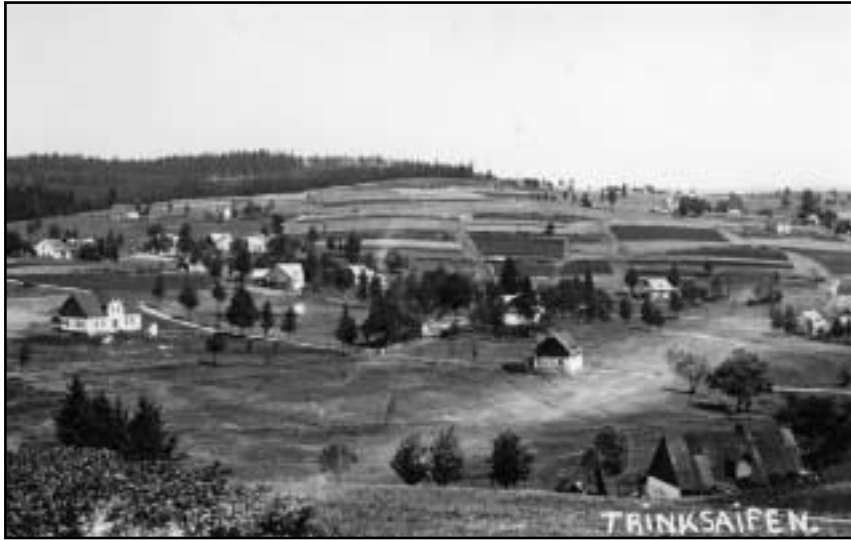
Pohled na zadní část obce Rudné od silnice na Přebuz ve 20. letech 20. století.

dny jsem jedl mrkev z polí, kyselá jablka a chleba. Tou dobou jsem již shodil nějakých sedm kilo a cítil se stále lépe.