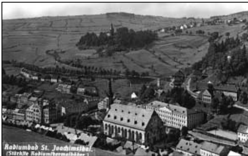
St. Joachimsthal. Pohled na kostel a hrad Himlštejn ve 30. letech 20. století. Dnes zcela neznámé jsou holé a obdělávané svahy Krušných hor v okolí Jáchymova.

dům. Hluboký a dramatický výhled do Podkrušnohorské pánve a na Doupovské hory mě okouznil. Cestou se výrazně zhoršilo počasí, těžké mraky ukusovaly Klínovec a nahoře nebylo nic vidět. Fičelo tam tak zběsile a telekomunikační věž v mlze tak skřípala, že jsem se raději rychle vydal dál. Když jsem došel až za tmy a zcela vysílen do Božího Daru (Gottesgab), nikdo na mne nečekal a já se svalil pod stříšku vlekářské boudy. Bylo mi všechno jedno. Dokonce mne za tmy tmoucí objevil majitel při každodenní kontrole, posvětil si na mne, viděl, jak usínám ve spacáku, a beze slova odešel. Byl jsem mu za to vděčný.