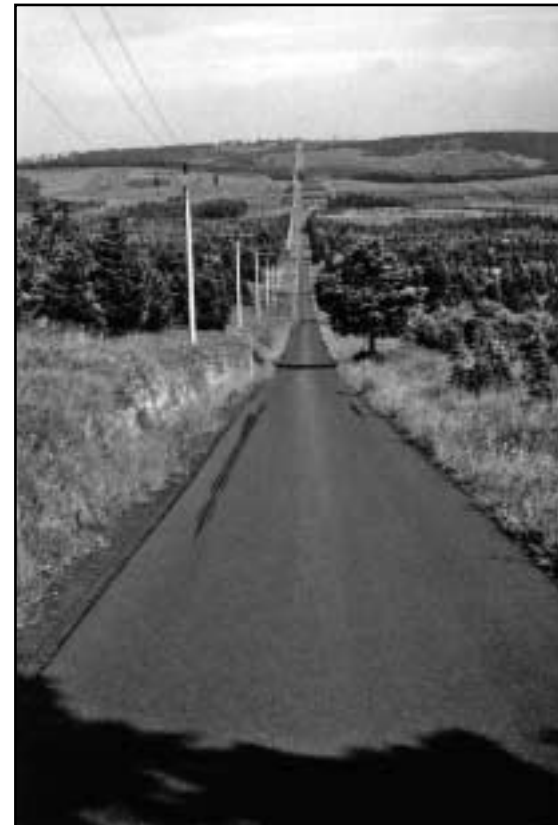
Dlouhá rovná silnice v lesnické oboře u Fláji.

Ten večer jsem vylezl na horu Bouřňák s krásným výhledem a majestátními bučinami a pokračoval přes Vrch tří pánů až na Stropník (Straubnitzerberg), kde jsem přespal. Celý vrcholek