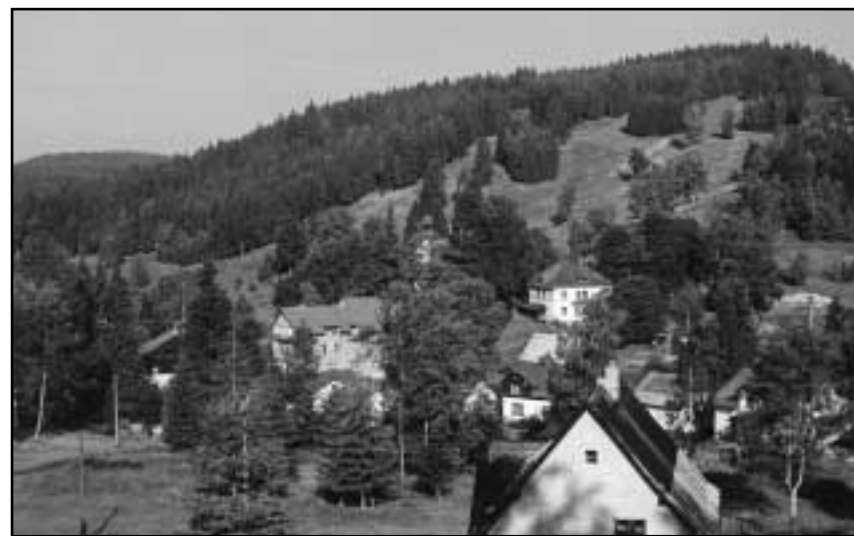
Dnešní pohled ukazuje opět typickou neporušenou krušnohorskou krajinu. Na protějším svahu je dnes sjezdovka.

kraj a obec Přebuz (Fribus) od 15. století žila. Ještě dnes jsou zde k vidění památky na toto období. Neklamnými znaky těžby jsou tzv. „pinky“ ve stráních (např. nad obcí Rudné ve stráni Skalnatného vrchu – Steinberg), které vypadají jako díry po dělostřeleckých granátech. Jsou to trychtýřovité propadliny nad stropem šachty. Další technickou památkou zdejšího kraje je vodní kanál, který přiváděl vodu z řeky Rolavy na území obce Rolava až pod Havraní vrch nad obcí Rudné. Toto jedenáct kilometrů dlouhé dílo pomáhalo při rýžování cínu. V roce 1930 žilo v městečku Přebuz 1 396 obyvatel a dnes pouhých 56. Tato parovinatá oblast končí Kraslickým Špičákem (Spitzberg – 991 m) a úchvatným Rájeckým údolím (Nancy), kde svahy prudce klesají z náhorní plošiny a padají do údolí obce Stríbrná (Silberbach) a města Kraslic (Graslitz), odkud se dále vlní již jen 800 metrů dosahující kopce, které nadobro končí u Vysokého kamene (Hoher Stein – 773 m) u vsi Kostelní (Kirchberg). Kopce se svažují kolem údolí až do Lubů (Schönbach). Zde se krajina rovná a nachází se zde doly na kaolín.