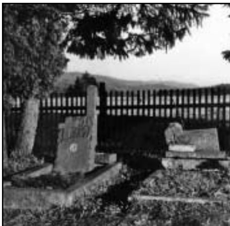
Sudetský hřbitov v Rudném, kde jsou pochováni místní rodáci.

Chomutovsku a Mostecku stejně jako pro zpracovatelský průmysl. Jisté ale je, že sezonní rekreatanti v tak vysokém počtu velmi narušují životnost obce, které se nedostává bytů pro mladé, pracovní síly ani finančních prostředků. Od 70. let se rekreatanti v obci stali lidry kulturního života a pořádali pravidelné akce, v jejichž rámci se setkávali místní a Pražáci.