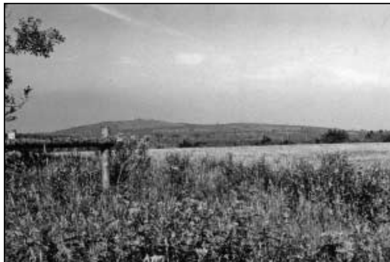
Nejvyšší hora východních Krušných hor – Loučná.

Ráno jsem vyrazil směrem k hoře Bouřňák. Vzal jsem to přes Horní Krupku (Graupen), protože mě lákal starodávný kostel a slavná hornická minulost. Celá tato obec je postavena ve velmi prudkém svahu. Žít v tak strmé stráni musí být zajímavé. Má to svá pro i proti. Snadno domyslet jaká. U kostela tu