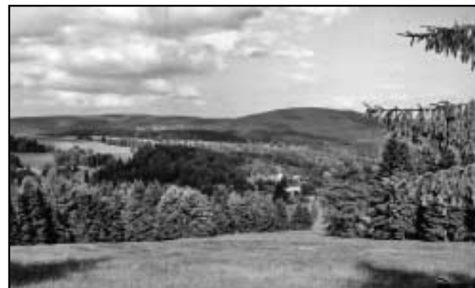
Obec Trinksaifen (Rudné) ve 20. letech 20. století. Pohled od jihozápadu směrem k části obce Rabenberg (Havran) a až k Peindlbergu s rozhlednou, Novým Hamrům a Tisové.

Dnešní údolí obce je stejně malebné. Není moc zarostlé, je spíše ukázkou ideálu současné pohraniční krajiny.