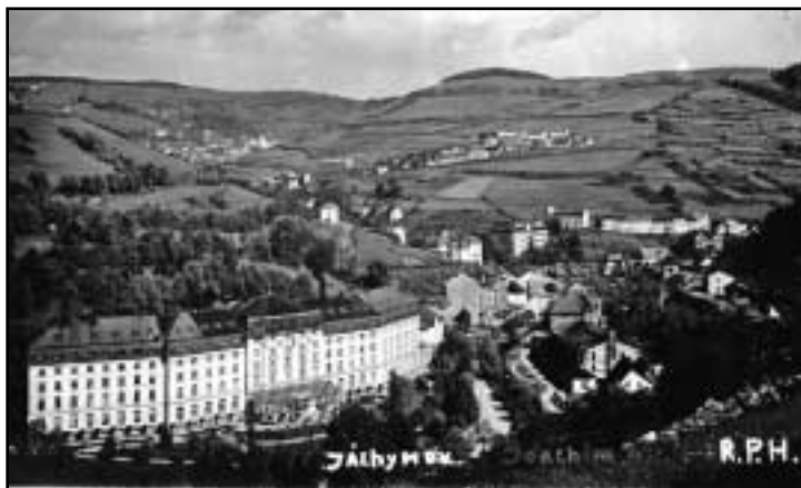
Jáchymov ve 30. letech 20. století. Typická zemědělsky využívaná a proměněně udržovaná horská krajina Krušných hor.

dokonce mezi poli nedělají meze a jsou rozlišovány jen trochu vyšší a širší brázdou.