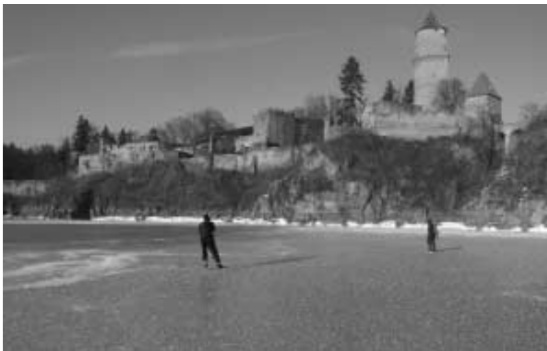
▪ Pod Zvíkovem (J. S.)

a rychlobruslemi je obrovský. Při všech testech zatím vždy s přehledem zvítězili ti, kdo jeli na připínacích dlouhých bruslích, rychlobrusle se umístily na místě druhém a kanady zůstaly jen kousek pod svahem. Kromě toho, že sundavací brusle jedou nesrovnatelně lépe, taktéž lépe zvládají hrbolatý led, praskliny, nerovnosti a malé překážky. Výhodu rychlého odepnutí na Orlíku příliš neoceníme, led je všude, nicméně si s sebou nemusíme brát náhradní boty, čímž se ulehčí zádům.