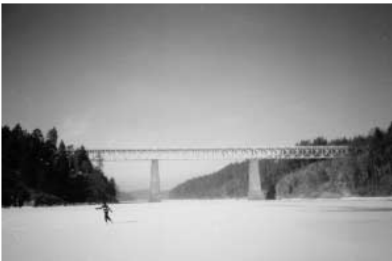
▪ Železniční most u Červené (T. M.)

Po překonání praskliny se vlevo na skále objeví zámek Orlík, v zimě pro návštěvníky uzavřený, výstup na pevnou zem zde ovšem zmínit musíme, neboť jde o jedno z mála míst, kde najdete civilizaci ve formě autobusového spojení, případně občerstvení. V přístupném prostoru před zámkem můžete obdivovat pávy, správní budovy panství v tyrolském stylu, případně si s místními zahrát hokej na jezírku u zimní zahrady. K zámku se vydrápeme přes přístaviště na jižním břehu. Schůdky bývají zapadané sněhem a kvůli poklesu ledu musíme překonat několik metrů nakloněných ledových ker, které se povalují na břehu, což je nejen obtížné, ale i trochu nebezpečné. Bruslení samo je pohyb vhodný a zdravý i pro velmi staré lidi, osoby s omezenou pohyblivostí, tloušťky i malé děti. Výstup k zámku Orlík zvládnou pouze zdatní jedinci, takže pozor na řádné plánování cesty. Například v březnu roku 2005 došlo k tak výraznému poklesu hladiny, že výstup se rovnal slušnému výkonu horolezce na ledovci.