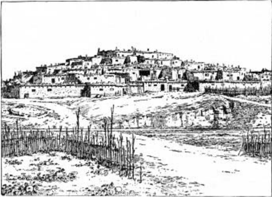
Typické terasovité společné pueblo

rodů a rod tvoří skupina lidí spojená příbuzenským vztahem. Děti náležejí k rodu matky. Manželství se uzavírá vždy mezi příslušníky různých rodů; manžel a otec musejí být členy jiného rodu než matka a děti zcela náležejí k rodu matky. Vychovávají je její bratři nebo matčiny sestry, jsou-li samozřejmě ještě naživu. Manžel je považován pouze za hosta manželky a rodu a v rodině nemá prakticky žádnou autoritu, kromě respektu, který si případně vydobude svými osobními schopnostmi a vlastnostmi. Pokud jde o schopného a moudrého člověka, mohou od něj přijímat rady, nicméně každý rod si žárlivě střeží svá práva, a jeho členové by diktát ze strany manžela – hosta nikdy nepřijali. Rodu nevládne žena; vůdčí osobností je stařešina. Pokud však už není schopen vedení, nahradí ho schopný mladší člověk, který je podle platného práva uznán za stařešinu. Nad rodovými náčelníky stojí kmenoví náčelníci, kteří mají své pomocníky. Toto organizační schéma se liší kmen od kmene. U některých rodů je náčelnictví dědičné, jinde se náčelník volí. Soukromé materiální vlastnictví se omezuje většinou jen na oděv, ozdoby a drobné předměty. Rod vlastní většinu statků, například domy, půdu, z půdy získané potraviny a zvěř ulovenou při společné štvanci. Rody se také sdružují do skupin, jež se nazývají frátrie. Ty mají své vlastní náčelníky, kteří stojí mezi rodovými a kmenovými autoritami. Kmeny se někdy sdružují do svazů, jimž vládne svazový náčelník. Vedle svazových náčelníků, fratrií a rodů