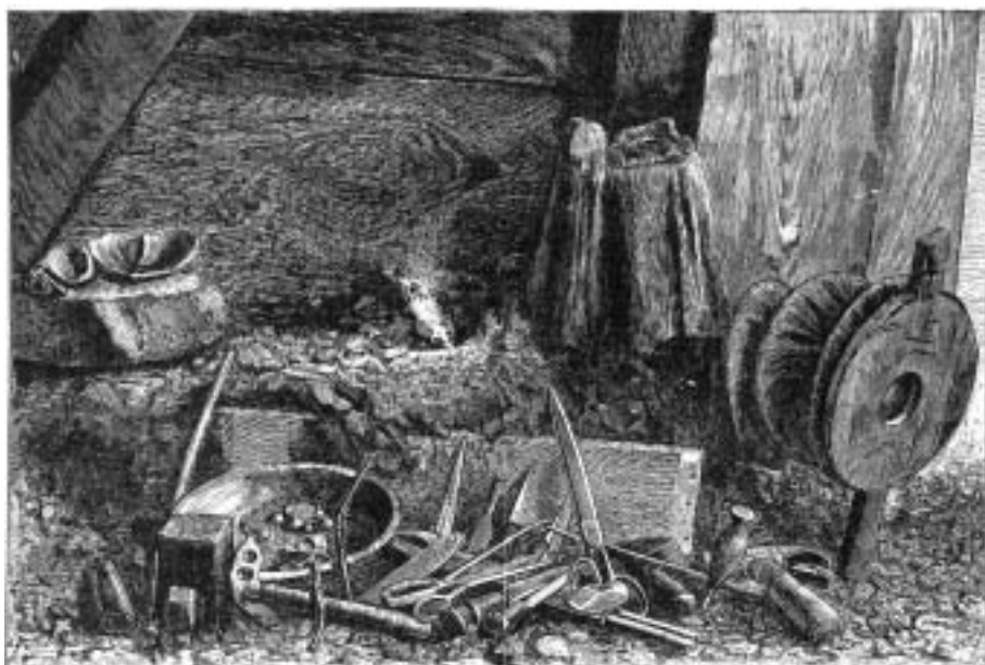
Dílna navažského stříbrotepece

a ubývání měsíce, třpyt hvězd, příchod komet, záře meteorů, střídání ročních dob, mraky, vítr, déšť, sníh a další fyzikální úkazy, se udržují v povědomí těchto lidí jako činy posvátných zvířecích božstev. Věří, že dokáží různé bohy přesvědčit, aby sloužili jejich zájmům. Proto se pokládají náboženští vůdci za stejně důležité jako kmenoví náčelníci a proto jsou kouzelníci rovnocenní náčelníkům. U některých kmenů má náboženská sekta větší moc než rod; jinde má větší váhu rodový náčelník; nicméně náboženští a kmenoví náčelníci musejí mezi sebou věčně soupeřit o moc.