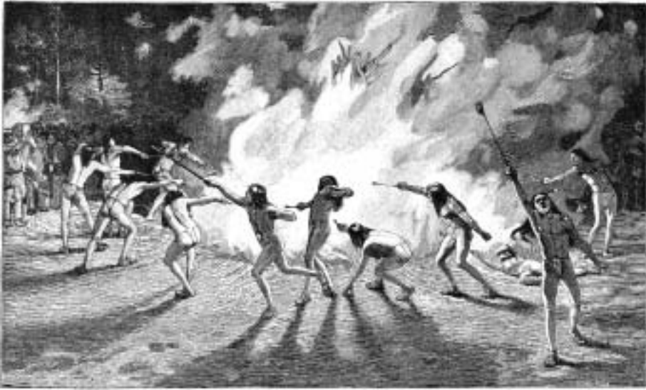
Navazský ohňový tanec

Po obědě se vydáváme na další cestu. Je nádherný den, takže se s jedním Indiánem odpoutáváme od karavany, abychom si prohlédli krajinu. Tryskem společně projíždíme krajinou směrem k velkému platu, jež leží ve značné vzdálenosti před námi. Planina Salahkai je porostlá nádherným lesem. Jízda je úžasná a vzrušující. Poté, co se terén stává kamenitým, vedeme koně dále jen krokem. Můj indiánský společník sedí na nádherném hnědákovi a je vynikajícím jezdcem. Nosí šátek na hlavě a dlouhé vlasy mu sahají až na ramena. Mezi pronikavými černými očima vystupuje orlí nos; okolo krku má několik tuctů korálových náhrdelníků, vyrobených z kousků perleti a tyrkysu, navlečených na nitích, ukroucených ze šlach. Zdobí ho i stříbrné náušnice a na zápěstích se mu blýskají stříbrné náramky. Jeho kamaše jsou ušité z černého sametu, který zřejmě nakoupil od nějakého překupníka; žlutohnědé mokasíny zdobí stříbrné ornamenty a koňský postroj má podobné ornamenty. Hraje si s ručnicí, jako by to byla zápalka, a s koněm zachází velmi obratně. Mezi sebou se snadno dorozumíváme místním žargonem a znakovou řečí. Po dlouhé jízdě v temnotách sestupujeme k úpatí stolové hory a svůj tábor nacházíme poblíž jezírka. Karavana oslů ještě nedorazila, ale zakrátko se i se svými indiánskými pohaněči objevují jeden za druhým v táboře. V táboře pobývá několik etnických skupin: běloši, Oraibové, Walpiové a Navahové. Všichni mezi sebou vycházejí bez problémů.