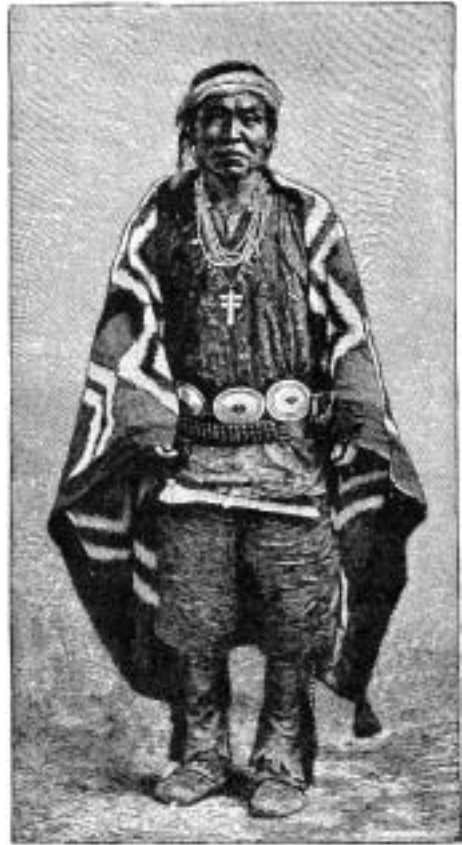
Navazské stříbrné ozdoby

Dne 1. listopadu. Po krátké jízdě odpočíváme v Rock Spring. Na úpatí stolové hory prýští vydatný pramen. Další etapa vede krásným územím. Po naší levé ruce se táhne dlouhá linie útesů, připomínající Vermilion Cliffs v Utahu. Kolem nás jsou tytéž červené pískovce a po výstupu na útesy se před námi otevírá scenerie, která jako by z oka vypadla pohledu z Kaibabského plató. Vysoká skalní věž tyčící se nad touto plošinou je známá pod jménem Navajo Church . Již brzy odpoledne se dostáváme do Fort Wingate. Pevnost je umístěná na pěkném místě při úpatí Zuni Plateau. Karavana soumarů zde dosáhla svého cíle a nezbývá nic jiného, než se s našimi indiánskými přáteli rozloučit. Moji vlastní lidé se na koních vrátí do Utahu a já bych se z Fort Wingate měl vydat ve voze do Santa Fé. Protože okolní krajina je pro svou zvláštní geologickou stavbu a množství zřícenin dávných puebel velmi zajímavá, vydávám se nazítří, 2. listopadu, s kapitánem Johnsonem z dělostřelecké kavalerie do okolí. Míjíme velké množství prastarých zřícenin různých staveb, z nichž jsou nejzajímavější válcovité věže. Sice z nich zůstalo jen obvodové zdivo, ale stavby mají dvě až tři patra