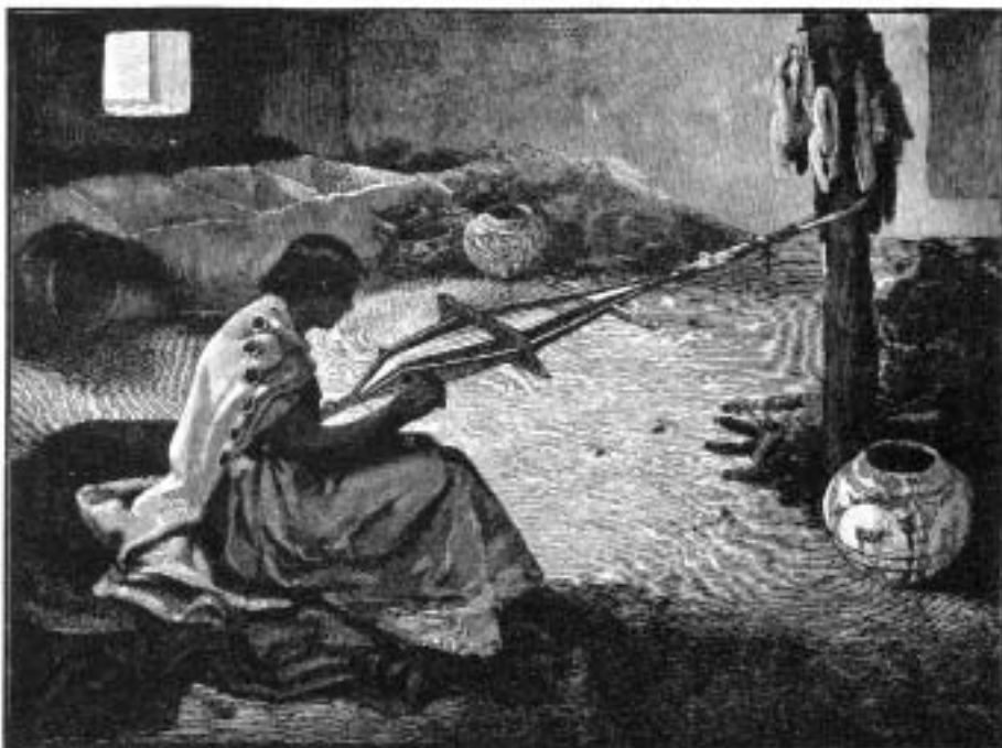
Zunijská žena při tkaní pásu

nikání výbojů, vzniká mezi nimi tzv. náhradní příbuzenství. Jeden kmen zastupuje prarodiče, druhý otce, třetí staršího bratra, čtvrtý mladšího bratra atd. V rámci těchto náhradních příbuzenských svazků se členové jednoho kmene obracejí na druhý kmen přesně podle platného příbuzenského vztahu, jenž je dán dohodou. Do rodu se výjimečně přijímají i cizí osoby, které v rámci kmene zastávají určité postavení. Adopci obyčejně uskutečňuje žena, která určitou osobu prohlašuje za svého nejmladšího syna či dceru, a adoptovaná osoba získává takové postavení, jako by se u kmene skutečně narodila. Dítě, jež se v rodě narodilo před jejím příchodem, které může být staré jen jeden rok, nazývá starším bratrem