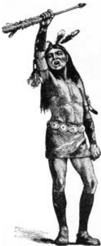
Tanečník držící velký opeřený šíp