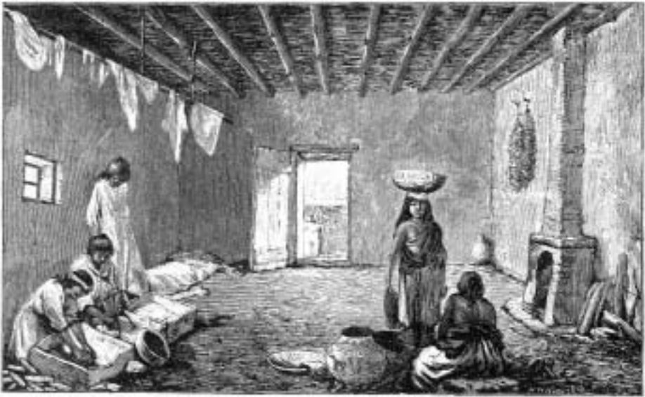
Místnost v pueblu Zuni

novou policií, která udržuje pořádek a vykonává tresty. Za bojovníky se vybírají z různých rodů mladíci, kteří pak podle svých zásluh dosahují patřičných hodností. Bojovníci vytvářejí bratrstva, v nichž se členové navzájem rozlišují podle věkových kategorií. Navzájem si prokazují respekt ve všech válečných záležitostech a v prosazování spravedlnosti.