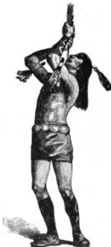
Tanečník „polykající“ velký opeřený šíp

se rozlišují ještě rady. Ty nejsou zákonodárným shromážděním v našem pojetí. Rozhodnutí rady jsou brána jako precedens. Kmenové právo zahrnuje především zvykové právo, které vychází z místních zvyků a obyčejů a řeší problémy, jež přináší každodenní život. Nastalé problémy se řeší tím nejlepším možným způsobem. Rozhodnutí rady jsou platná pouze v přítomnosti a mají za úkol řešit a mírnit spory tak, aby byl zachován mír. Neexistuje žádná psaná ústava nebo zákoník, ale je dodržován tradiční řád, který se dochoval v ústním podání v podobě ustálených rčení. Každé pravidlo, jímž se rada řídí, a výsledek jejího rozhodování se dříve nebo později chápou jako nová norma.