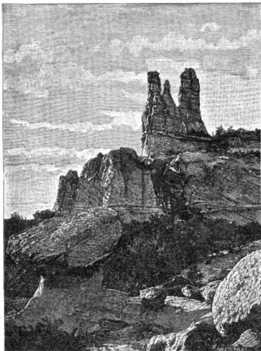
Navajo Church poblíž Fort Wingate

a jsou široké asi 18 až 20 stop. Pravděpodobně byly vztyčeny z náboženských důvodů.