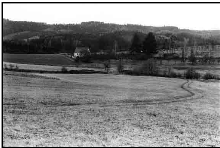
U Nového Knína. Charakteristická středočeská krajina na jih od Prahy: nevysoké kopce pokryté lesem, pole s hnědými půdami, zaniklé původní polní cesty, zpustlé sady a zarůstající pastviny, měkká melancholie (H. Rysová).

Střední Čechy jsou nenápadné, ale přitom melodické, málokde dosahují monumentality, je obtížné nalézt nějaké společné „logo“ — byl by to Karlštejn nebo Říp? Nedá se v nich udělat bombastický reklamní obrázek na cigarety Marlboro, ale jen na místní pivo. Jejich nejhodnotnější místa bývají malá a zranitelná. Obvyklý návštěvník je snadno přehlédne, investor je neváhá zničit. Středočeská krajina je rozbitá na malé kousky sítí dálnic a komunikací. Ve středočeském prostoru je nejenom civilizace, ale i příroda více globalizovaná než kdykoliv předtím. Podobně