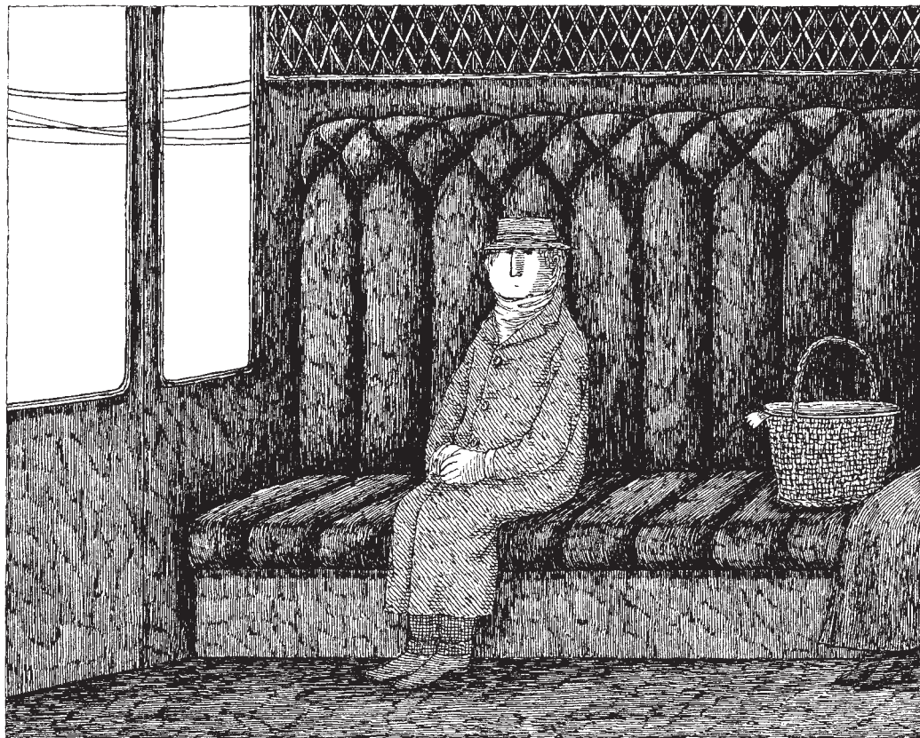
Netečně seděl v kupé.