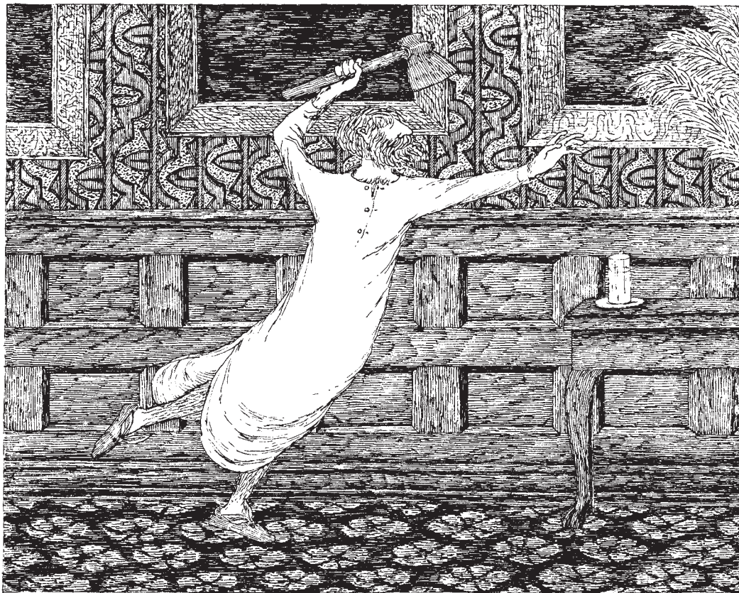
Manicky proběhl halou.