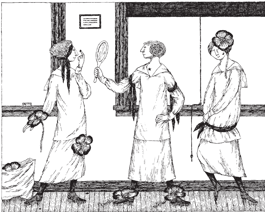
Kouzelně se vymódily.