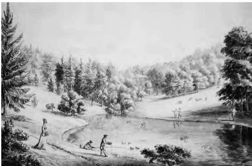
Obr. 3. Krajinářský park v Hestercombe, Somerset. Kresba Coplestona W. Bampfyldea, kolem r. 1775.

uchopitelný, jak naznačuje následující Walpoleův výrok o anglických parcích: „Byly to zmenšené lesy a rozšířené zahrady.“ 34 Humphry Repton zase rozlišení zahrada – park – krajina (resp. les) zakládá na druzích pohledu z dálky klasifikovaných skrze různé druhy krajinomalby: