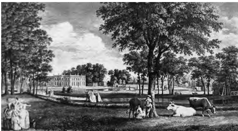
Obr. 1. Pokus o sjednocení krásy a užitečnosti v zahradní architektuře: ferme ornée. Zde výjev ze šedesátihektarové Woburn Farm na rytině Luka Sullivana z r. 1756.

ve smyslu zhuštění toho „nejlepšího“, co se v přírodě nachází (v případě zahrady i toto zhuštění mělo původně utilitární podobu: na malé ploše soustřeďovala to, co bychom jinak museli pracně shánět po lesích a lukách). 13 Definice umění zahrad, která se objevuje v Latapieho francouzském překladu Whatelyho pojednání a podle které se jedná o „umění co nejdokonaleji uspořádat přírodní předměty“ 14 , by tedy měla vystihovat i povahu malířství pojímaného jako umění hovořící „řečí věcí“ či „přirozených znaků“, na rozdíl od poezie, jež užívá znaků arbitrárních. 15 Umění zahrad v očích svých přívrženců někdy malířství i předstihovalo, zejména proto, že se nespokojuje s pouhým napodobováním; viz například hodnocení Hirschfeldovo: „Umění zahrad překonává