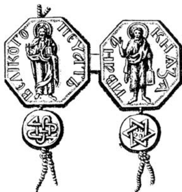
Pečeť Ivana Kality

Krátce před svou smrtí určil Dmitrij Donský svým nástupcem nejstaršího syna Vasilije. Tuto volbu chán Tochtamyš potvrdil.