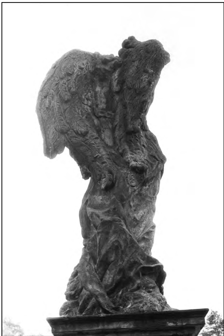
Křídla anděla z Lysé.