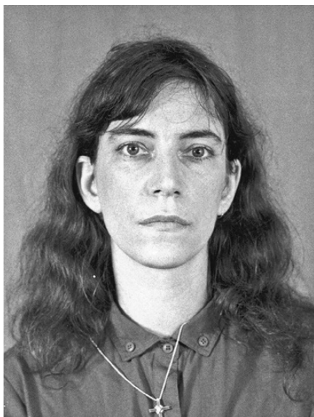
Patti, fotografie na vízum

jako úleva od horka a prachu. Poslouchali jsme nářek simultánních saxofonů ve stylu Coltranea, který se linul z betonových činžáků. Ráno jsme se vydali na průzkum Cayenne. Náměstí mělo tvar lichoběžníku, bylo černobíle dlážděné a orámované vysokými palmami. Nic netušíce jsme se ve městě octli v čase karnevalu a ulice byly pusté. Radnice v koloniálním stylu, dřevěná a natřená na bílo, byla po čas svátku zavřená. Na konci náměstí nás k sobě zvánlivě opuštěný kostel. Došli jsme k jeho vratům; když jsme vzali za kliku, zůstala nám na rukou rez. U vchodu jsme vhodili mince do kávové dózy, stará americká značka se sloganem Nebeská káva . Do paprsků světla se rozprskli roztoči prachu a uspořádali se do svatozáře nad andělem ze zářícího alabastru; ikony svatých stály lapeny za nahromaděnou sutí, sotva rozpoznatelné za vrstvami temného laku.