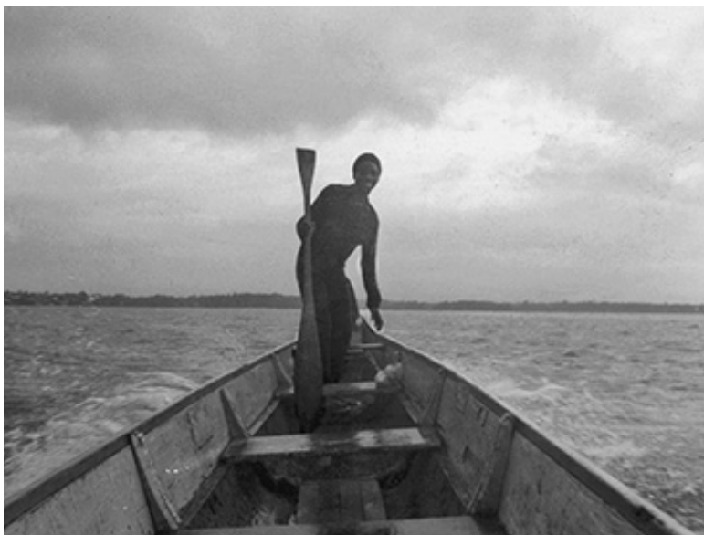
Průvodce, řeka Maroni