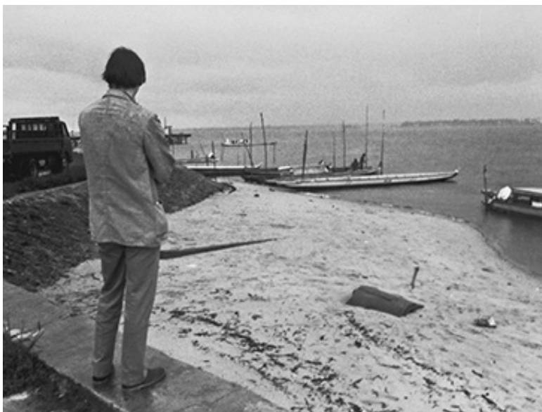
Fred, řeka Maroni

Po několika dnech ukrutného vedra v hlavním městě Paramaribo nás průvodce odvezl 150 kilometrů do města Albina na západním břehu řeky tvořící hranici s Francouzskou Guyanou. Růžové nebe bylo protkané žilami blesků. Náš průvodce sehnal místního chlapce, který se uvolil, že nás převezde přes řeku Maroni na piroze, dlouhé úzké lodi vydlabané z kmene stromu. Věci jsme si sbalili prozíravě, takže jsme se zavazadly mohli zacházet snadno. Na plavbu jsme se vydali v lehkém dešti, který rychle nabral na síle a během pár chvil se proměnil v přívalový liják. Chlapec mi podal deštník a varoval nás, abychom nebrouzdali prsty ve vodě podél nízkého lemu lodi. V tu chvíli jsem si všimla, že se řeka hemží malinkými černými rybkami. Piraně! Ucukla jsem rukou a chlapec se zasmál.