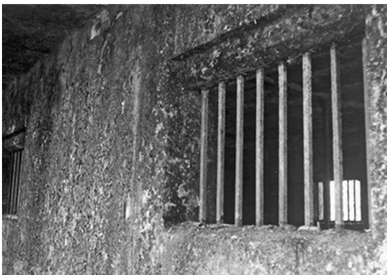
Mříže společné cely

prázdné ulice, kterou jsem nikdy předtím neviděla a zřejmě ji nikdy znovu nespatřím. Tímto úsekem procházeli kdysi vězni. Zavřela jsem oči a představovala si je, jak se táhnou dusivým horkem s řetězy na nohou; kruté pobavení pro hrstku obyvatel prašného, opuštěného městečka.