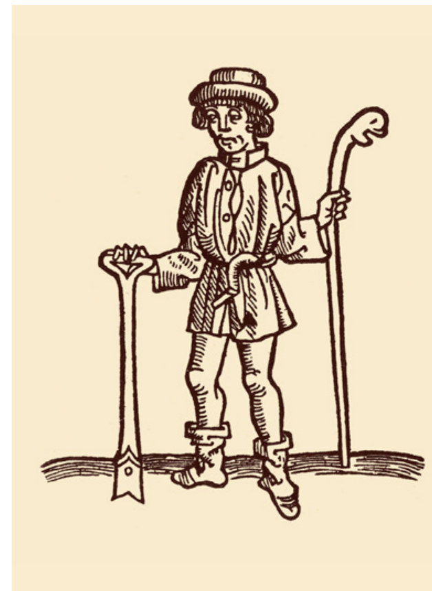
Pozdně středověký zemědělec s holí a úzkým rýčem (Stephanus Boeck van dem Shakspele, Lübeck, 1498, dřevorez).

RÝČ A PŘESLICE • SOCIÁLNÍ STATUS ROLNÍKA • STRUKTURA OSÍDLENÍ: DVORY A VESNICE • RADONICE NAD OHŘÍ A DALŠÍ ČESKÉ ZEMĚPANSKÉ DVORY • STŘEDOVĚKÉ VESNICE A PUTUJÍCÍ ZEMĚDĚLCI • URBÁŘE • TVAR POLÍ • CHLĚB NA HNOJI VYROSTLÝ • DALŠÍ TŘI PŘÍBĚHY: TENTOKRÁT O LESNÍCH PŮDÁCH • LUPINA A LES • MNIŠKA, BÍLÝ LESMISTR A ZALESŇOVÁNÍ KALAMITNÍCH HOLIN • Z VÁLEČNÝCH ZÁPISKŮ MÉHO DĚDEČKA