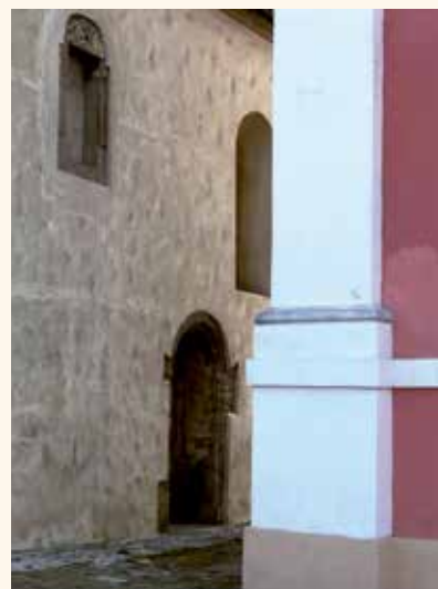
Obr. 18. Tetínské kostely. Románské motivy se mísí s barokními.

Tiší a kontemplativní poutníci by v okolí Tetína mohli navštívit tři pozoruhodná, mytická místa. Tím prvním je hradiště Kotýz s Jelínkovým mostem a Axamitovou branou. Zejména mohutný most působí jako brána do jiného světa. Podvečerní návštěva Zlatého koně, kde již utichl ruch, a opuštěného