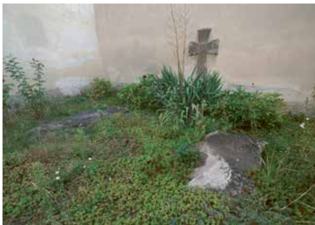
Obr. 2. Křemencové náhrobní kameny na malém hřbitově u kostela sv. Kateřiny.

stavena hranolová věž. Kostel je postaven z rádkového zdiva s obdélnými, polokruhem sklenutými okny. V jižním boku stavby byla při posledních opravách ponechána obnažena základová a přízemní část zdiva z velkých bloků zajímavých hornin. Jednak se v několika případech jedná o holocenní pěnovce, jejichž původ může být, jak již bylo výše komentováno, v Kodě nebo ve Svatém Janu pod Skalou. Převažující horninou tohoto základu, snad románského původu, jsou bloky karbonského arkóзовého pískovce mnohde červenavých a hnědavých barev, které se staly základní surovinou pozdně románských a románsko-gotických staveb v širokém prostoru severního Plzeňska, Žatecka a Rakovnicka (Vroutek). Odtud, tedy z velmi dalekého zdroje, snad může pocházet i surovina použitá v tomto tetínském kostele.