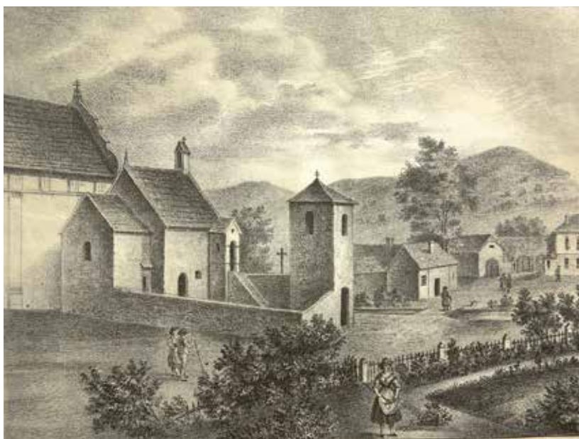
Obr. 4. Pohled na Tetín z oken fary, kde působil Václav Hájek z Libočan. Na levé straně vidíme románský kostel sv. Kateřiny a větší barokní kostel sv. Ludmily, vpravo na obzoru se zvedá hora Damil. (Litografie kolem roku 1850)