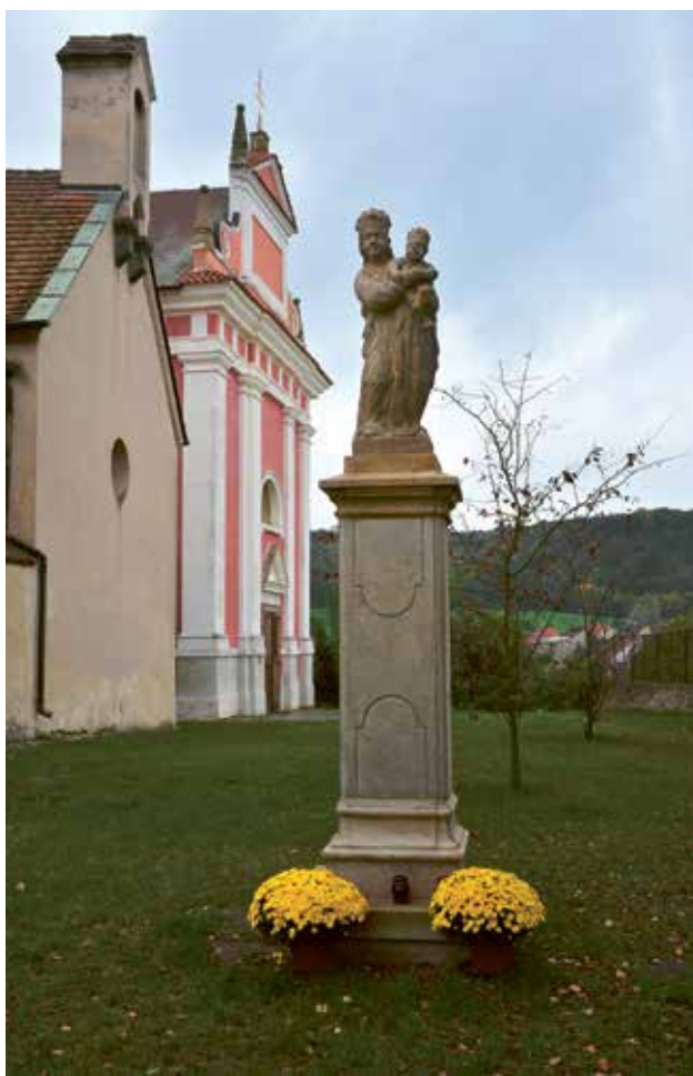
Obr. 11. Barokní socha Panny Marie s Jezulátkem od sochaře Františka Brayera stojí z boku kostela sv. Kateřiny.

tek. Samozřejmostí bylo také pořádání finančních sbírek, především na údržbu a obnovu kostelů a jejich inventáře.