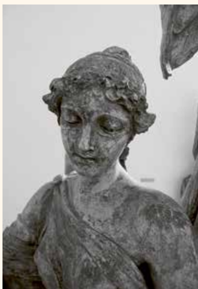
Obr. 15. Jedním z velkých motivů 19. století byla úcta k minulosti. Stejnomená figura Bohuslava Schnircha z konce 19. století, sádra, Lapidárium hl. m. Prahy.

zdůraznili, že jsou legitimními dědici české koruny. Stejně jako ostatní patroni je i zobrazení sv. Ludmily součástí nové výzdoby svatovítské katedrály.