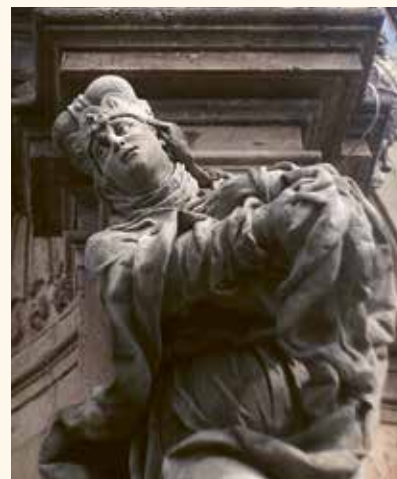
Obr. 14. Vrcholně barokní sloup se sousoším Nejsvětější Trojice vystavěl v letech 1727–1730 patrně Antonín Braun podle návrhu Ferdinanda Maxmiliána Kaňky na prostranství u zámeckého kostela Nejsvětější Trojice na západním okraji městečka Valeč (Waltsch), detail sv. Ludmily.

Po útlumu v 15. století dosahuje svatoludmilský kult dalšího vrcholu v baroku. Protireformační působení kazatelů Tovaryšstva Ježíšova a dominikánů přinášelo rozvoj národního cítění. Zvláště jezuité (příchod do našich zemí 1556) prosazovali češtví pomocí šíření kultu svatého Václava jako patrona české státnosti i českého jazyka 12 a svaté Ludmily. V první polovině 17. století začíná v rámci programu katolické protireformace hrát velkou roli zemský patriotismus. Podobně jako svého času Karel IV. se ke kultu českých zemských patronů oficiálně hlásí i Habsburkové, v rámci ideologie zdůrazňující zbožnost habsburského rodu – pietas Austriaca – se odvolávají na světce z rodu Přemyslovců, aby