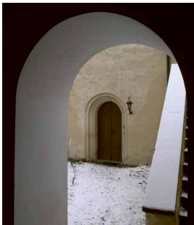
Obr. 12. Na hřbitov u kostela svaté Kateřiny vede průchod pod zvonící. Vpravo pak stoupá na kůr venkovní schodiště.

Díla jsou psaná tak, aby vyzdvihla svatost Ludmily, navozují představu mírné a Bohu oddané ženy, téměř vetché a dobromyslné stařenky, proti níž stojí zákeřná a vládychtivá Drahomíra. Zde nutno podotknout, že podle an-