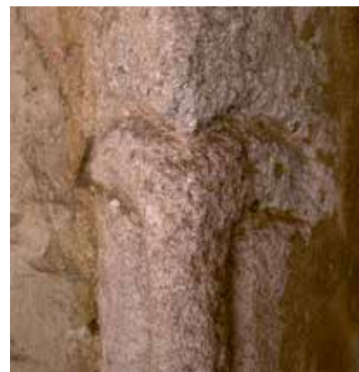
Obr. 10. Detail vnitřní části původního románského portálu kostela sv. Kateřiny z karbonové arkózy, který je strážěn u nás ojedinelým motivem dvou hadů, či spíš draků v dobovém pojetí.

Tato tradice pokračovala rovněž v 1. polovině 20. století, s jistými výkyvy danými mimo jiné světovou válkou. Zmínit lze v tomto ohledu například mohutnou pouť z roku 1910, která byla pořádána k údajnému tisícímu výročí založení kaple svatě Kateřiny, nebo mileniální pětitisícovou pouť v roce 1921 obnovující tradici v době poválečné. Rozpory mezi účastníky podmíněné tehdejším vznikem Církve československé a propagovaným „odklonem od Říma“ ale také vedly k šarvátkám vyžadujícím i zásah četnictva. Od roku 1926 se už poutě konaly nepřetržitě. Tradice úspěšně pokračovala a integrovala do sebe i nové prvky, jako například historické přednášky a prohlídky tetínských pamá-