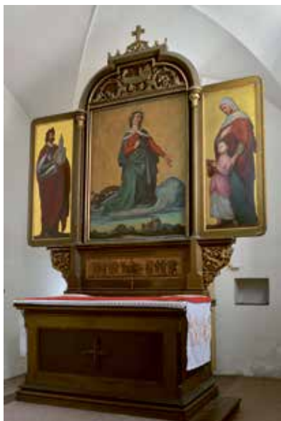
Obr. 8. Hlavní oltář malovaný (1855) Josefem Hellichem v kostele sv. Kateřiny. Ve středu je sv. Kateřina, na křídlech sv. Ferdinand a sv. Anna. Oltář byl poničen požárem a minimálně střední část je kopie z roku 1957 ze zadu signovaná M. Kučerou.