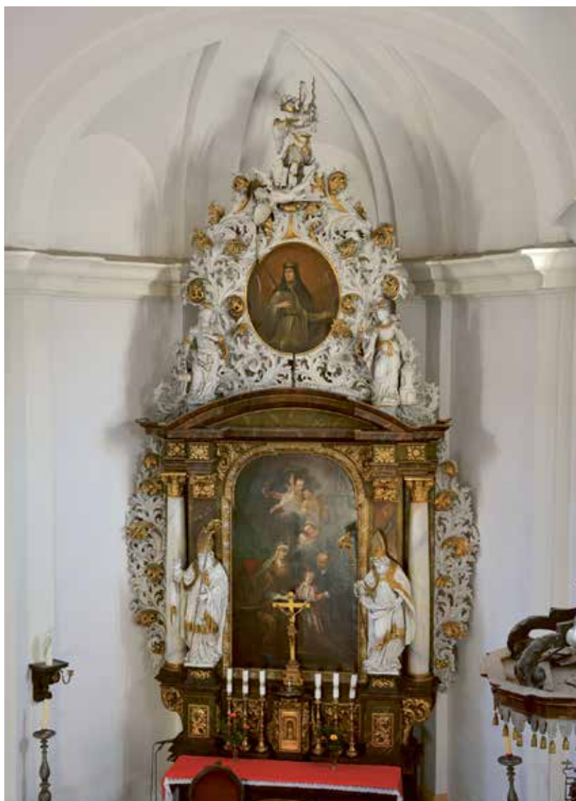
Obr. 13. Hlavní oltář kostela svaté Ludmily je pojat v uměleckém slohu rokoka. Uprostřed oltáře se nachází obraz na plátně od neznámého malíře, znázorňující kterak sv. Ludmila a kněz Kaich vyučují sv. Václava. Po stranách obrazu stojí sochy sv. Vojtěcha a Prokopa. V horní části je pak umístěn obraz sv. Ludmily. Nad ním je socha sv. Michaela potírajícího satana a na stranách sošky sv. Kateřiny a Barbory. Ve spodní části oltáře je umístěna mensa s kamenem, na němž měla být sv. Ludmila usmrcena.

Je zjevné, že se musíme spokojit s obecným závěrem, zřejmé je jen to, že Ludmila byla uškrcena a nikoliv zabita mečem, jak si přála. Nebyla jí tedy dopřána smrt po vzoru mučedníků, kdy musí být prolita krev, což posléze činilo jistě překážky pro její svatořečení a nejasnosti ohledně interpretace jejího zavraždění.