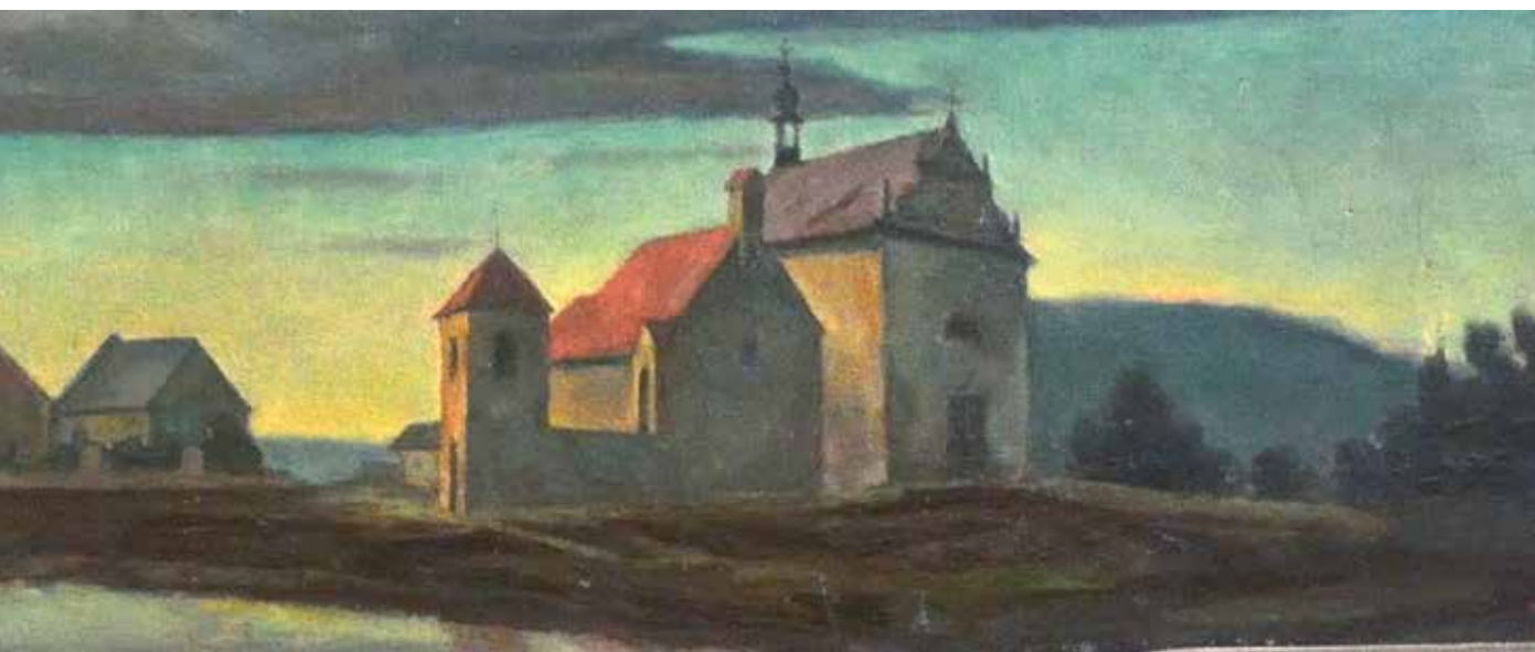
Obr. 9. Detail z oltáře Josefa Hellicha s Tetínem a okolní krajinou.

stalo i datem určujícím čas tetínských poutí odehrávajících se o první následující neděli. Kostel zasvěcený svatě Ludmile vznikl na Tetíně nejpozději před rokem 1266. Jeho poutní význam dokládají odpustkové listiny vydané v Avignonu v letech 1326–1327 na popud biskupa Jana z Dražic, jež umožňovaly získat odpustky lidem, kteří kostel navštíví v určených dnech, přispějí na jeho údržbu či stavbu, obejdou hřbitov a budou se modlit za živé a mrtvé, doprovodí Tělo Páně či svatý olej nemocných a při klekání se třikrát pomodlí Zdrávas Maria.