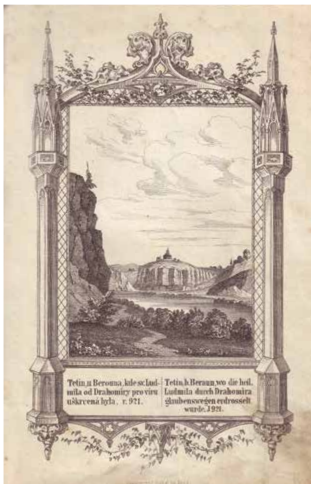
Obr. 16. Pohled na Tetín z anonymní poutnické knížky „Život svatě Ludmily“ z roku 1857–8.