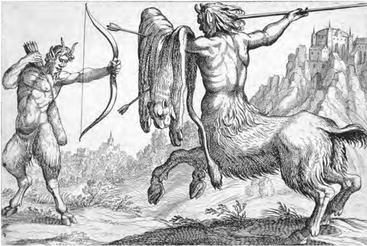
Nahore: Kentaur útočí na satyra, rytina Hendrika Houlieta I., Holandsko kolem roku 1610. Naproti: kentaufi útočí, ilustrace Gustava Doreho pro Dantovo Peklo, 1861.