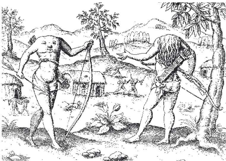
Nahore: Vyobrazení blemnyů z díla Brevis & Admiranda Descriptio Regni Guianae sira Waltera Raleigha z roku 1599.