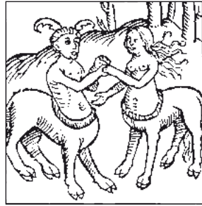
Dole: Vyobrazení láskajících faunů, Londýn kolem roku 1520.