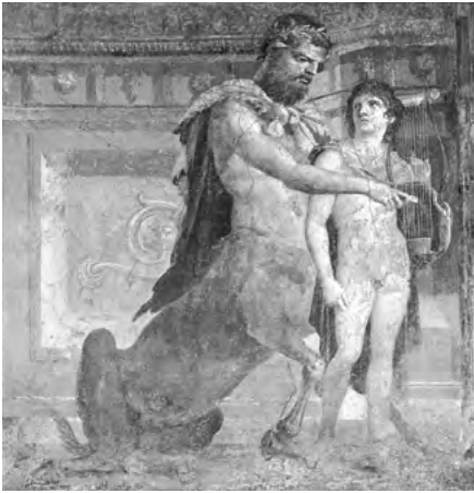
Vlevo: Cheirón učí Achilla hrát na lyru. Románská freska z Herculaneum z 1. stol. n. l.