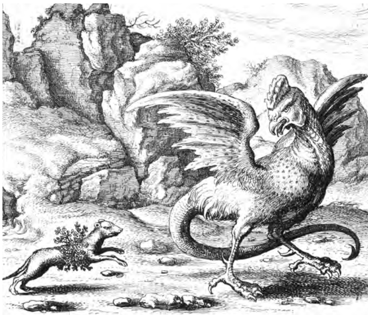
Nahoře: Lasička a bazilisek, rytina Václava Hollara (1607–1677). Lasičky jsou imunní vůči vražednému pohledu baziliseka a dovedou otrávit kousnutím.