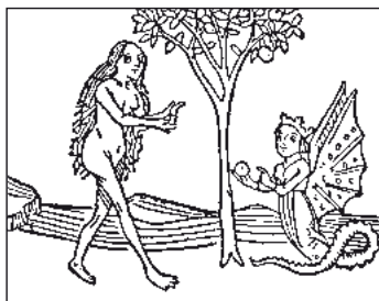
Vlevo: Bazilisek od Melchiora Lorche, 1548. Vpravo: Eva a had svádějící ji k hříchu, Gunther Zainer, 1470. Do dob středověku vstoupil bazilisek jako tvor s kohoutí hlavou upomínající na jeho ptačí rodiče.